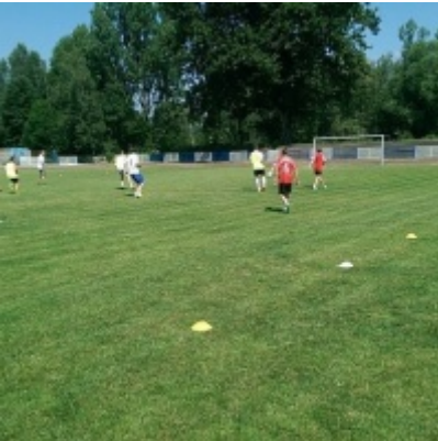
Turniej piłki nożnej