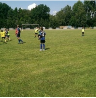
Turniej piłki nożnej