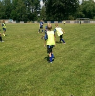
Turniej piłki nożnej