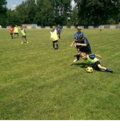
Turniej piłki nożnej