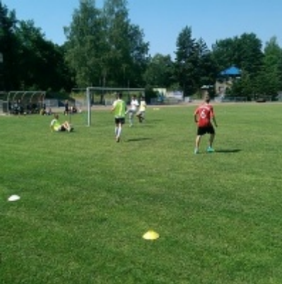
Turniej piłki nożnej