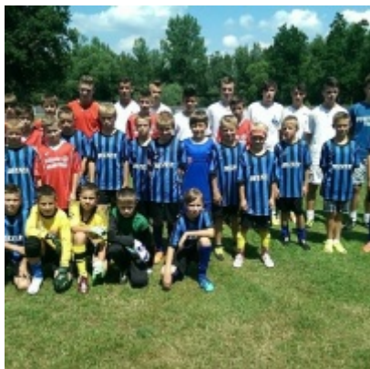
Turniej piłki nożnej