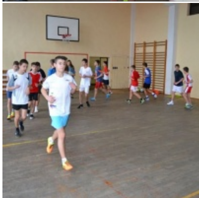
LKS Zatorzanka na obozie zimowym w Jaworzynce.