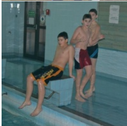
LKS Zatorzanka na obozie zimowym w Jaworzynce.