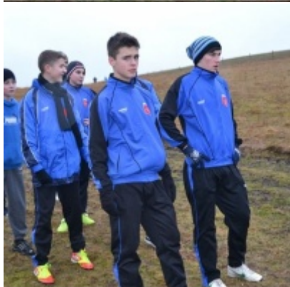
LKS Zatorzanka na obozie zimowym w Jaworzynce.