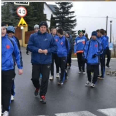
LKS Zatorzanka na obozie zimowym w Jaworzynce.