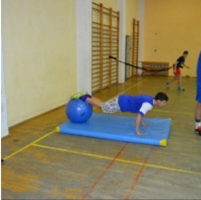
LKS Zatorzanka na obozie zimowym w Jaworzynce.