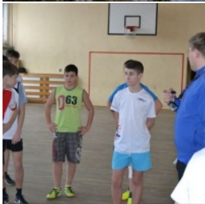
LKS Zatorzanka na obozie zimowym w Jaworzynce.