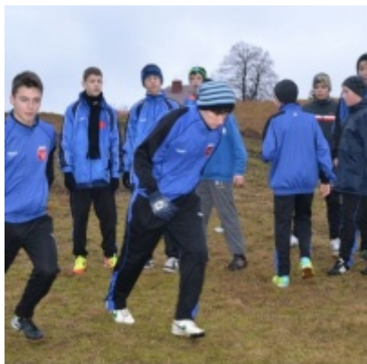
LKS Zatorzanka na obozie zimowym w Jaworzynce.