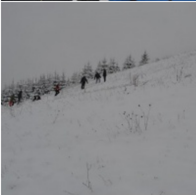
LKS Zatorzanka na obozie zimowym w Jaworzynce.