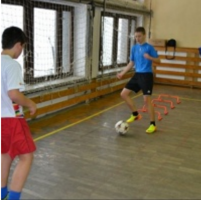
LKS Zatorzanka na obozie zimowym w Jaworzynce.