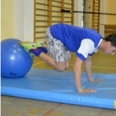
LKS Zatorzanka na obozie zimowym w Jaworzynce.