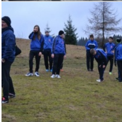
LKS Zatorzanka na obozie zimowym w Jaworzynce.