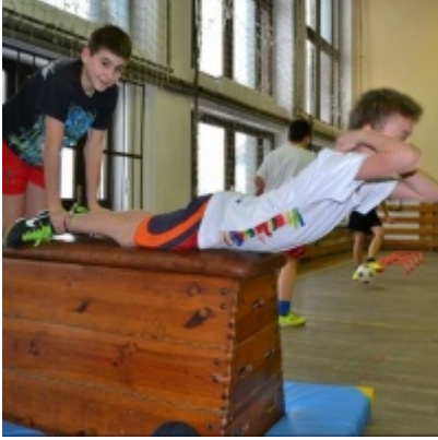
LKS Zatorzanka na obozie zimowym w Jaworzynce.