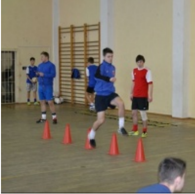
LKS Zatorzanka na obozie zimowym w Jaworzynce.