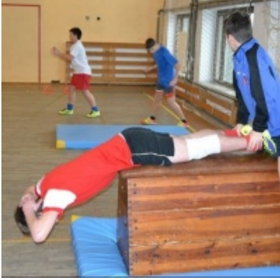
LKS Zatorzanka na obozie zimowym w Jaworzynce.