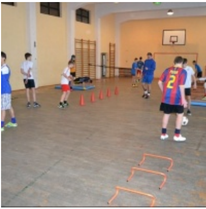
LKS Zatorzanka na obozie zimowym w Jaworzynce.