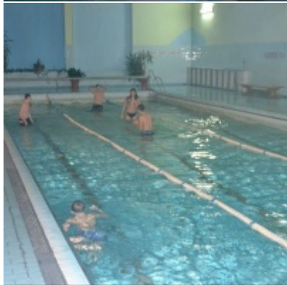
LKS Zatorzanka na obozie zimowym w Jaworzynce.