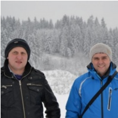
LKS Zatorzanka na obozie zimowym w Jaworzynce.