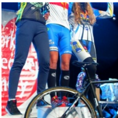
Dwa medale Mistrzostw Polski przybyły do Zatora.