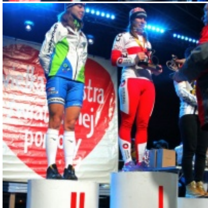
Dwa medale Mistrzostw Polski przybyły do Zatora.