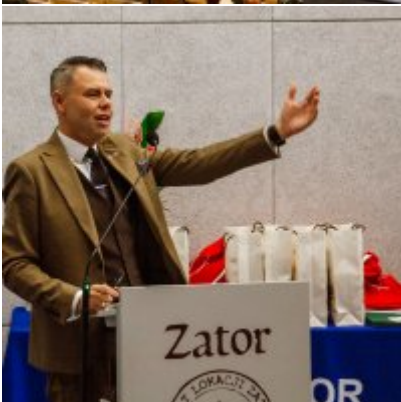
Sesja Rady Miejskiej w Zatorze z okazji 732 rocznicy lokacji Zatora