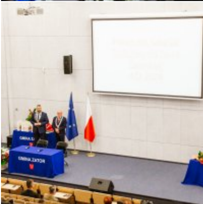
Sesja Rady Miejskiej w Zatorze z okazji 732 rocznicy lokacji Zatora