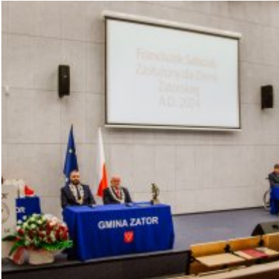
Sesja Rady Miejskiej w Zatorze z okazji 732 rocznicy lokacji Zatora