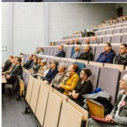
Sesja Rady Miejskiej w Zatorze z okazji 732 rocznicy lokacji Zatora