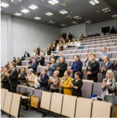
Sesja Rady Miejskiej w Zatorze z okazji 732 rocznicy lokacji Zatora