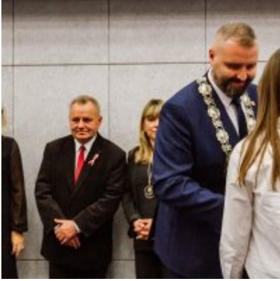
Sesja Rady Miejskiej w Zatorze z okazji 732 rocznicy lokacji Zatora