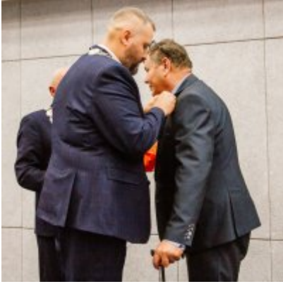
Sesja Rady Miejskiej w Zatorze z okazji 732 rocznicy lokacji Zatora