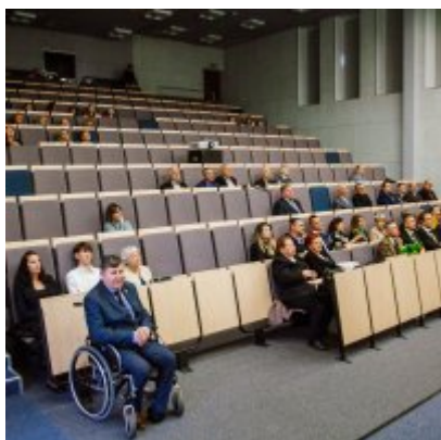
Sesja Rady Miejskiej w Zatorze z okazji 732 rocznicy lokacji Zatora