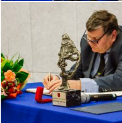
Sesja Rady Miejskiej w Zatorze z okazji 732 rocznicy lokacji Zatora