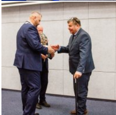
Sesja Rady Miejskiej w Zatorze z okazji 732 rocznicy lokacji Zatora