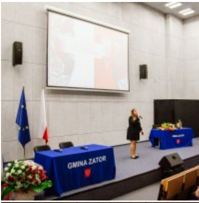
Sesja Rady Miejskiej w Zatorze z okazji 732 rocznicy lokacji Zatora