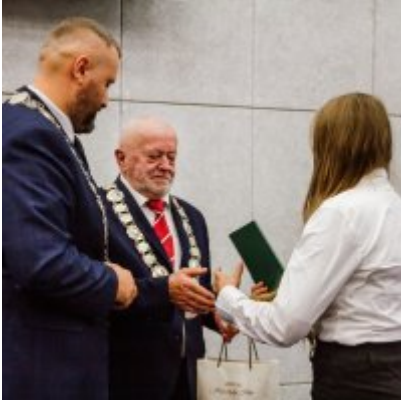
Sesja Rady Miejskiej w Zatorze z okazji 732 rocznicy lokacji Zatora