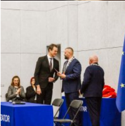
Sesja Rady Miejskiej w Zatorze z okazji 732 rocznicy lokacji Zatora