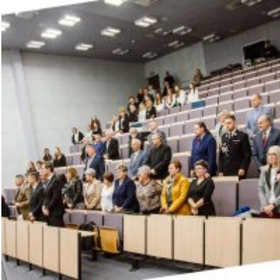
Sesja Rady Miejskiej w Zatorze z okazji 732 rocznicy lokacji Zatora