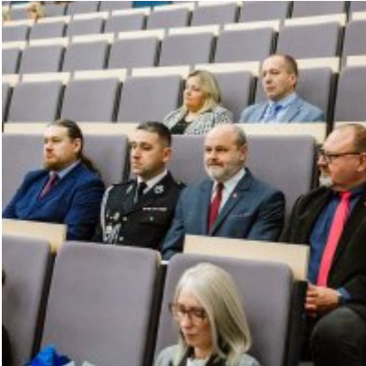
Sesja Rady Miejskiej w Zatorze z okazji 732 rocznicy lokacji Zatora