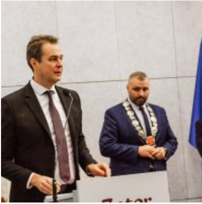
Sesja Rady Miejskiej w Zatorze z okazji 732 rocznicy lokacji Zatora