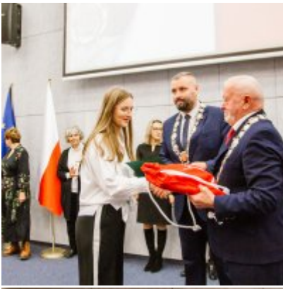
Sesja Rady Miejskiej w Zatorze z okazji 732 rocznicy lokacji Zatora