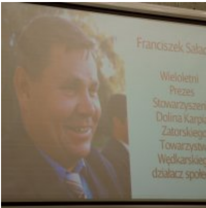
Sesja Rady Miejskiej w Zatorze z okazji 732 rocznicy lokacji Zatora