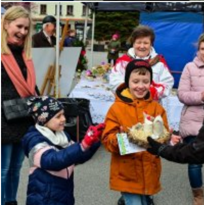
Jarmark Wielkanocny 2022