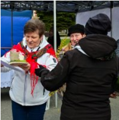
Jarmark Wielkanocny 2022