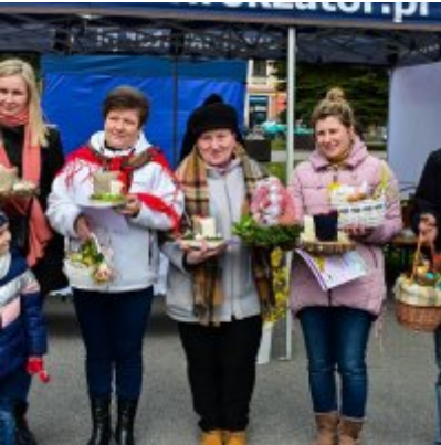
Jarmark Wielkanocny 2022