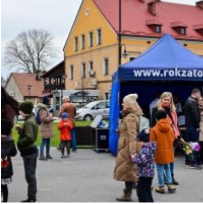
Jarmark Wielkanocny 2022