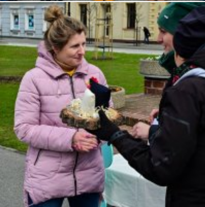
Jarmark Wielkanocny 2022