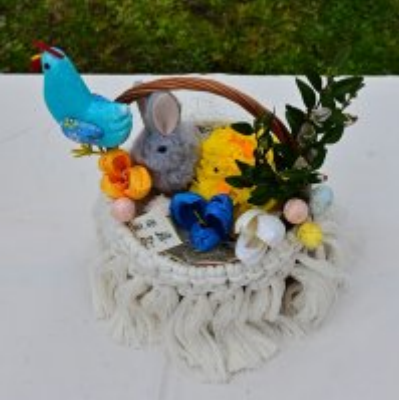
Jarmark Wielkanocny 2022