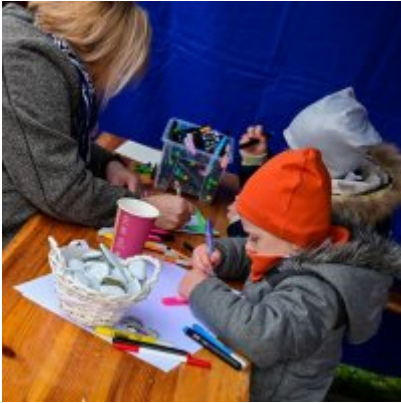
Jarmark Wielkanocny 2022