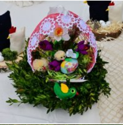
Jarmark Wielkanocny 2022