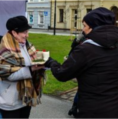
Jarmark Wielkanocny 2022