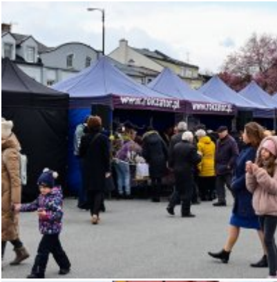
Jarmark Wielkanocny 2022