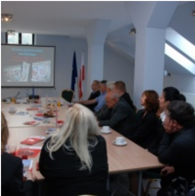
Europejskie Żniwa karpiove