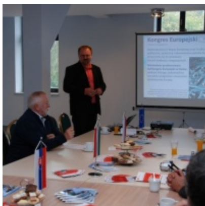
Europejskie Żniwa karpiove.