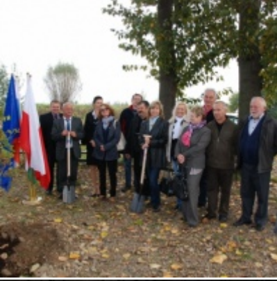
Europejskie Żniwa karpiove