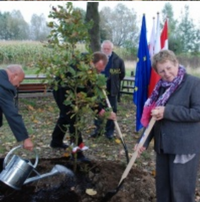
Europejskie Żniwa karpiove