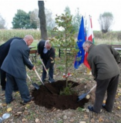
Europejskie Żniwa karpiove