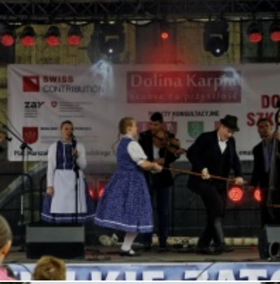
Europejskie Żniwa karpiove