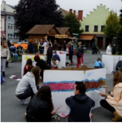
Europejskie Żniwa karpiove