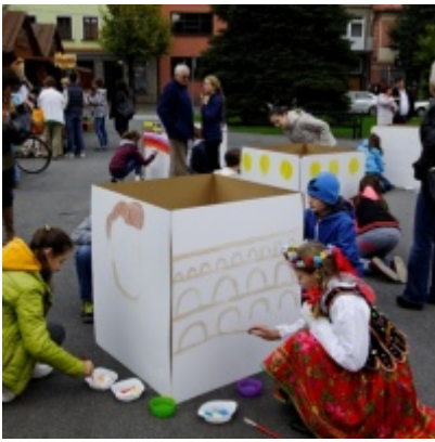
Europejskie Żniwa karpiove