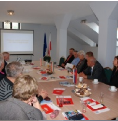
Europejskie Żniwa karpiove