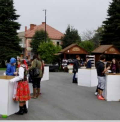
Europejskie Żniwa karpiove