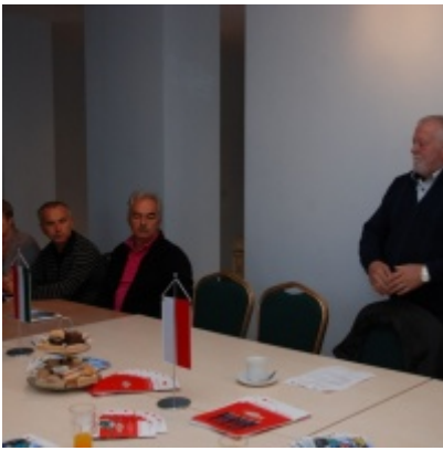
Europejskie Żniwa karpiove