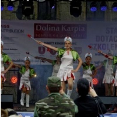
Europejskie Żniwa karpiove

Europejskie Żniwa Karpiove w Zatorze - strona 1