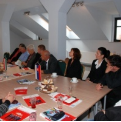
Europejskie Żniwa karpiove