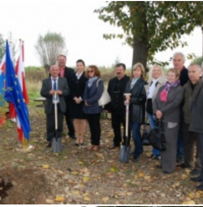
Europejskie Żniwa karpiove