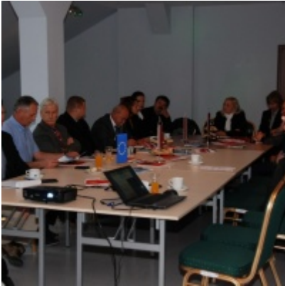
Europejskie Żniwa karpiove