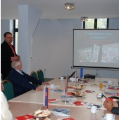
Europejskie Żniwa karpiove