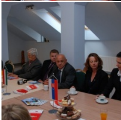
Europejskie Żniwa karpiove.