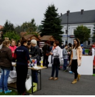
Europejskie Żniwa karpiove