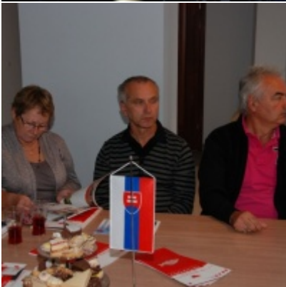
Europejskie Żniwa karpiove