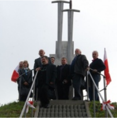
Europejskie Żniwa karpiove