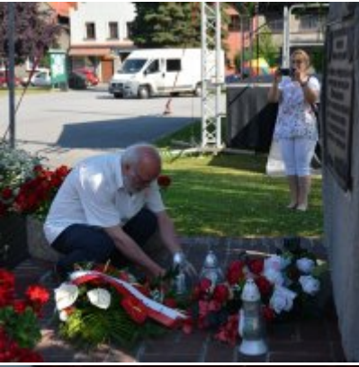
All Together Now