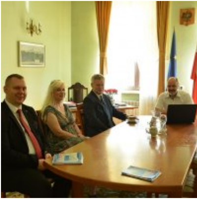
All Together Now