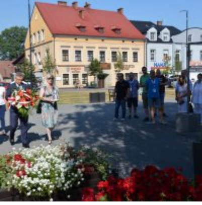
All Together Now