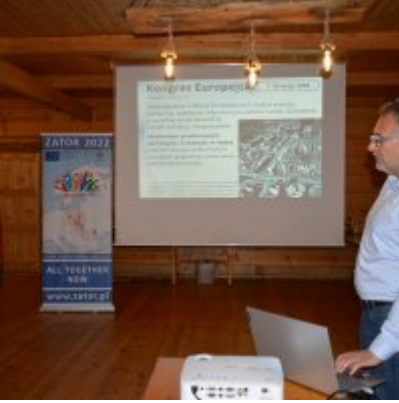
All Together Now