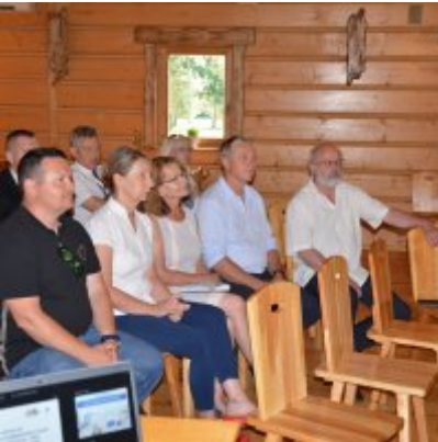
All Together Now