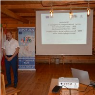
All Together Now