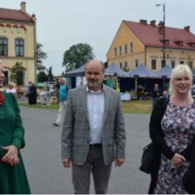
All Together Now