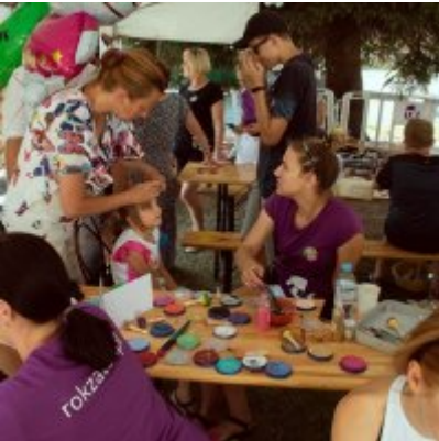
All Together Now