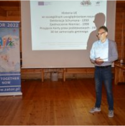
All Together Now