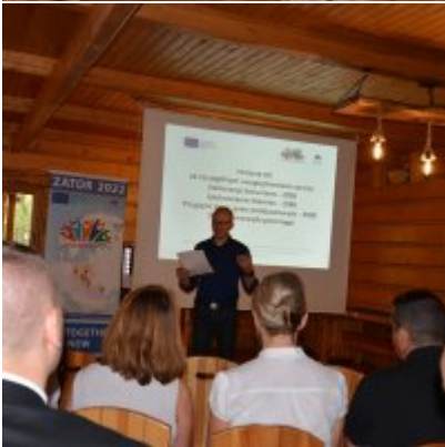
All Together Now