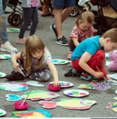
All Together Now