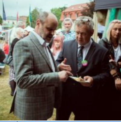
All Together Now