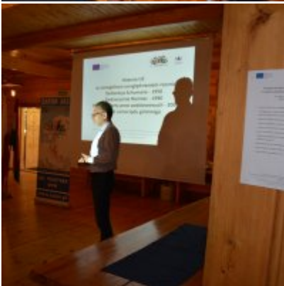
All Together Now