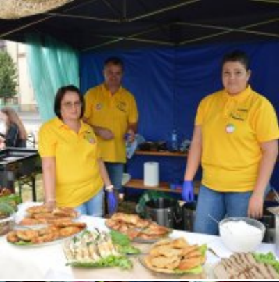
All Together Now