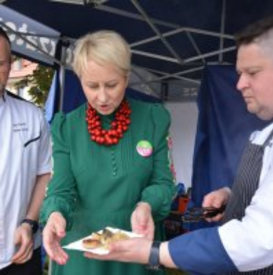
All Together Now