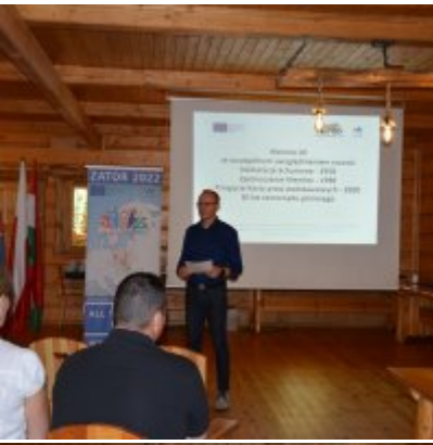
All Together Now