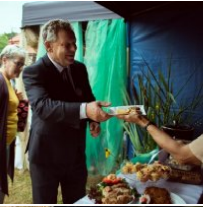
All Together Now