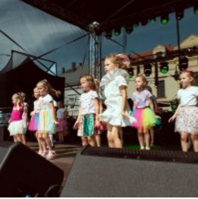
All Together Now