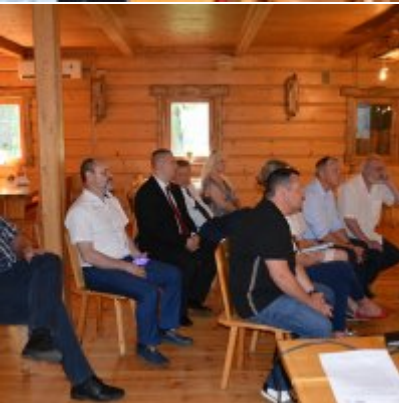
All Together Now