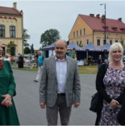
All Together Now