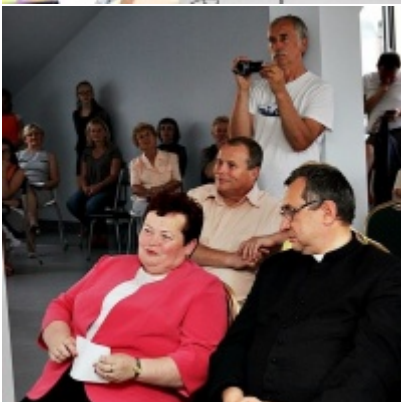
Otwarcie Izby Regionalnej Ziemi Zatorskiej