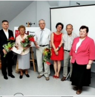
Otwarcie Izby Regionalnej Ziemi Zatorskiej