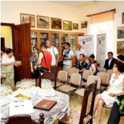
Otwarcie Izby Regionalnej Ziemi Zatorskiej