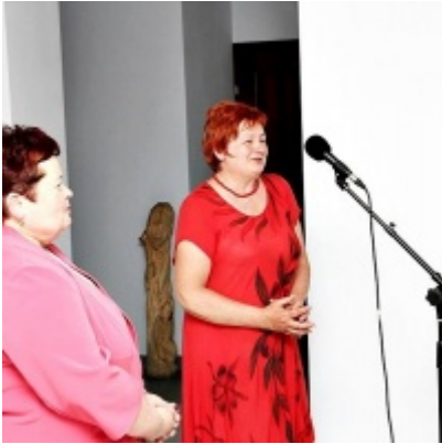
Otwarcie Izby Regionalnej Ziemi Zatorskiej