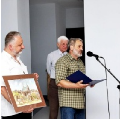
Otwarcie Izby Regionalnej Ziemi Zatorskiej