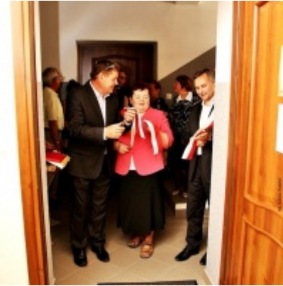
Otwarcie Izby Regionalnej Ziemi Zatorskiej