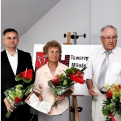
Otwarcie Izby Regionalnej Ziemi Zatorskiej