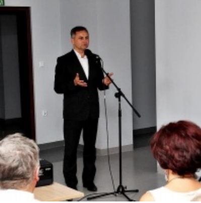
Otwarcie Izby Regionalnej Ziemi Zatorskiej