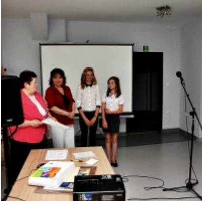
Otwarcie Izby Regionalnej Ziemi Zatorskiej