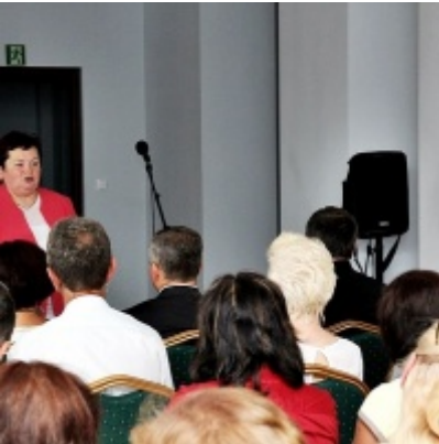
Otwarcie Izby Regionalnej Ziemi Zatorskiej