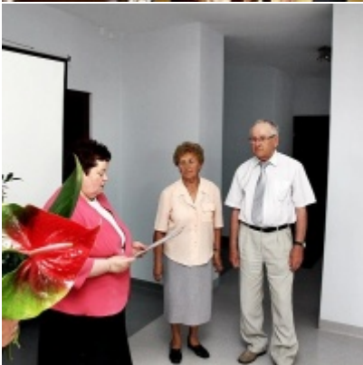
Otwarcie Izby Regionalnej Ziemi Zatorskiej