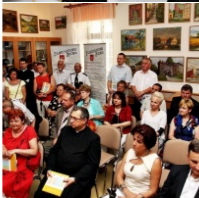
Otwarcie Izby Regionalnej Ziemi Zatorskiej