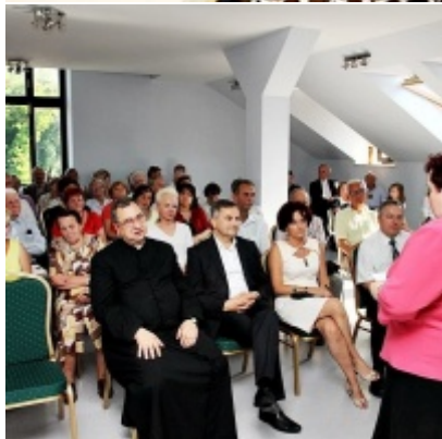
Otwarcie Izby Regionalnej Ziemi Zatorskiej