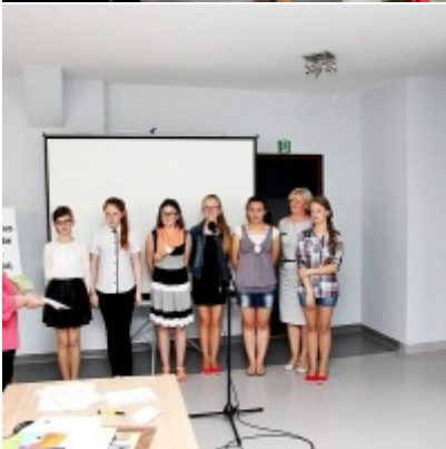
Otwarcie Izby Regionalnej Ziemi Zatorskiej