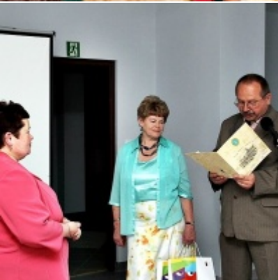
Otwarcie Izby Regionalnej Ziemi Zatorskiej