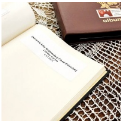
Otwarcie Izby Regionalnej Ziemi Zatorskiej