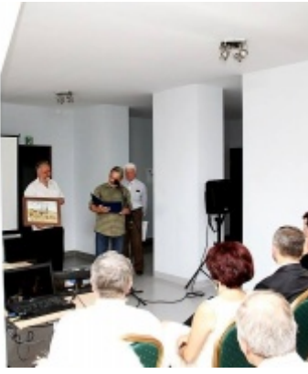
Otwarcie Izby Regionalnej Ziemi Zatorskiej