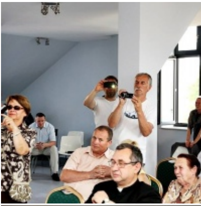
Otwarcie Izby Regionalnej Ziemi Zatorskiej