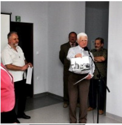
Otwarcie Izby Regionalnej Ziemi Zatorskiej