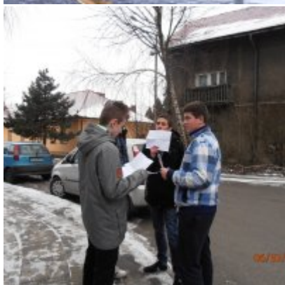
I Gra Miejska