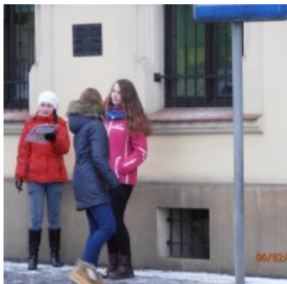
I Gra Miejska