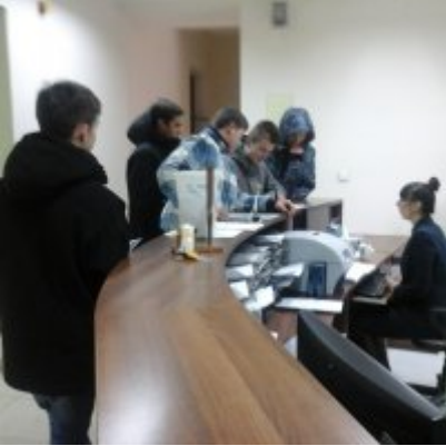
I Gra Miejska