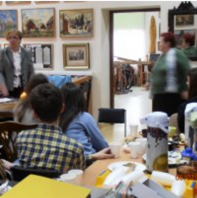
I Gra Miejska