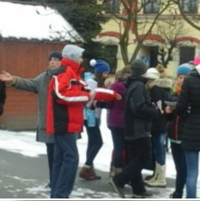
I Gra Miejska