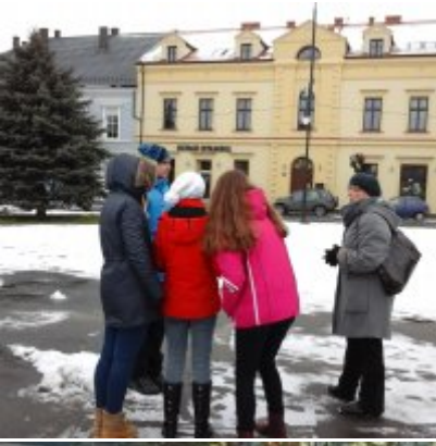
I Gra Miejska