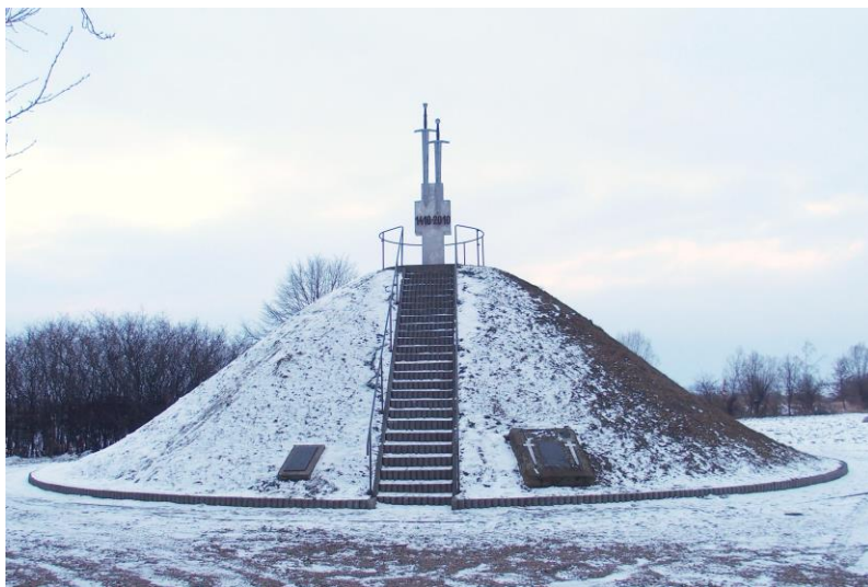
Zdjęcie nr 9. Kopiec Grunwaldzki w Palczowicach

Istotnym elementem krajobrazu kulturowego gminy Zator jest pomnik upamiętniający zwycięstwo Polaków nad Krzyżakami w Bitwie pod Grunwaldem.