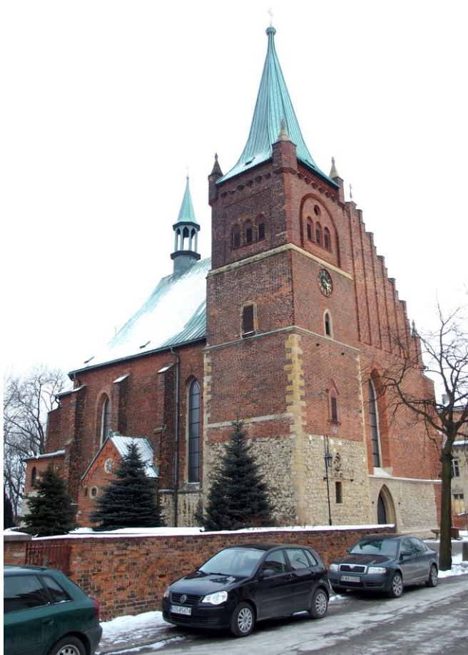
Zdjęcie nr 1. Kościół parafialny pw. Św. Wojciecha i Jerzego w Zatorze