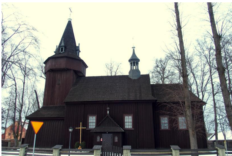
Zdjęcie nr 3. Kościół parafialny św. Jakuba Młodszeo w Palczowicach

Wybudowany w 1894 r., na miejscu poprzedniej świątyni z XV w., odnowiony w 1965 r. Kościół jest orientowany. Do położonego we wschodniej części kościoła prezbiterium przylega od północy zakrystia. Prezbiterium i nawę przykrywa gontowy, dwuspadowy, dwukalenicowy dach. Wieża konstrukcji słupowo - ramowej posiada ośmioboczną izbicę, a powyżej niej również ośmioboczny namiotowy dach kryty gontem, z którego wystają cztery wieżyczki. Wnętrze zostało wymalowane polichromią w XIX w. Oprócz ołtarza głównego w kościele znajdują się dwa XVII-wieczne późnorenesansowe ołtarze boczne.