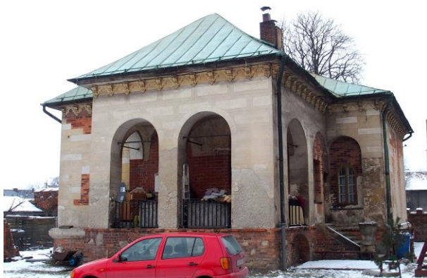
Zdjęcia nr 4, 5, 6. Zespół pałacowy w Zatorze