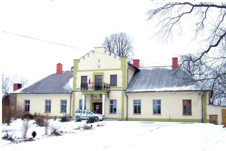
Zdjęcie nr 8. Dwór w Rudzach

Dwór powstał w 2 poł. XVIII w. Ufundował go burgrabia krakowski Jan Biberstein - Starowieyski. Dwór to budowla murowana z cegły, potynkowana, wzniesiona na planie prostokąta, parterowa, nakryta dachem czterosпадowym wykonanym z blachy. Fasada dziewięciosiowa, z centralnym trzyosiowym pozornym ryzalitem, zamkniętym schodkowym szczytem. Na osi budynku główne wejście, poprzedzone nowym gankiem kolumnowym podtrzymującym balkon. W elewacji ogrodowej trzy wydatne ryzalitty. Wygląd budynku zmienił się w wyniku ostatniego remontu, zniknęły uszate obramienia otworów okiennych, kartusz z herbem Jastrzębiec został przykryty nowszym tynkiem. Elewacje zachowały wydatny gzyms wieńczący i lizeny w narożnikach. Układ wnętrz z sienią na osi, również mógł ulec przekształceniom.