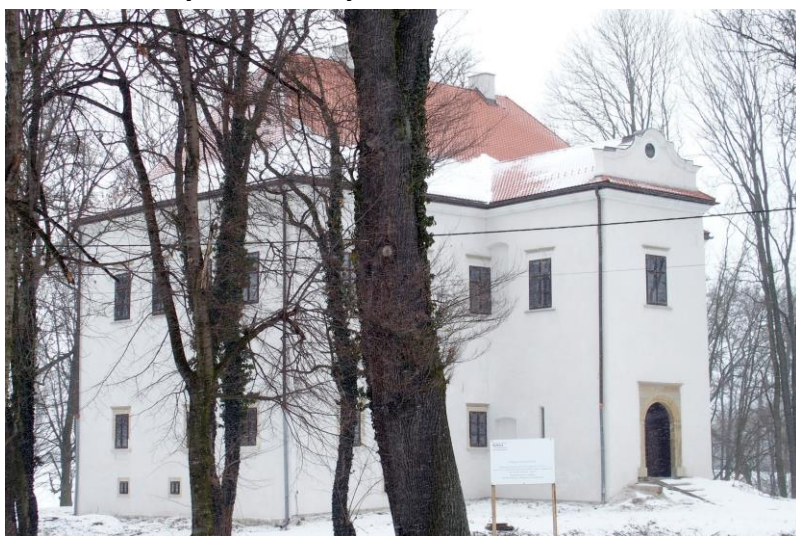
Zdjęcie nr 7. Dwór obronny w Graboszycach