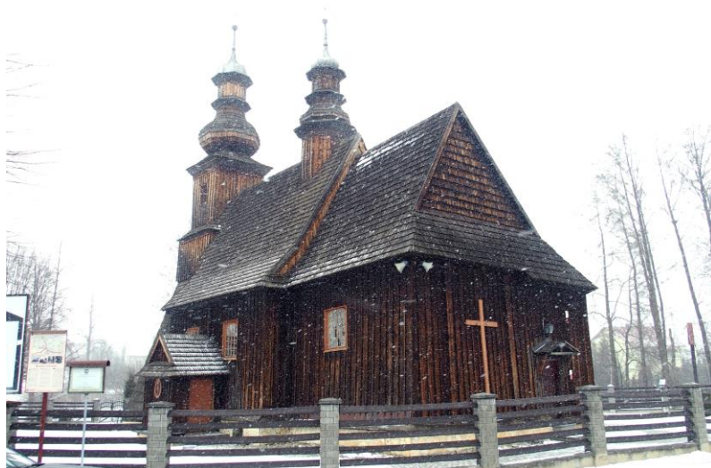
Zdjęcie nr 2. Kościół parafialny pw. św. Andrzeja w Graboszycach

Kościół wybudowany prawdopodobnie około 1585 r., w następnym stuleciu dobudowano wieżę izbicową od zachodu, którą następnie podwyższono w XVIII w. i nakryto baniastym hełmem. Znajduje się na Szlaku Architektury Drewnianej województwa małopolskiego.