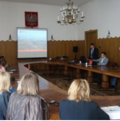
Delegacja z Ukrainy w Zatorze