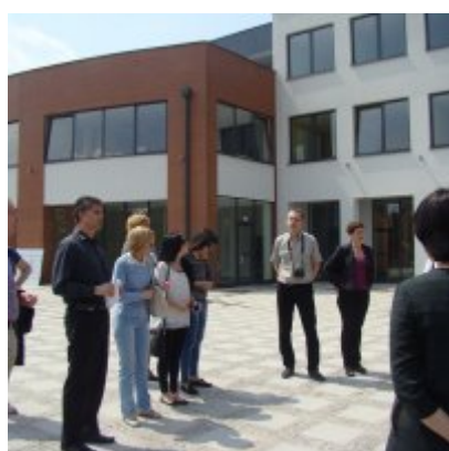
Delegacja z Ukrainy w Zatorze