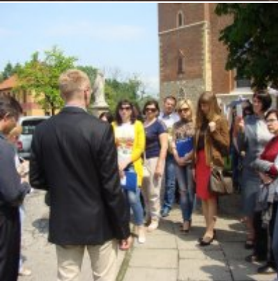
Delegacja z Ukrainy w Zatorze