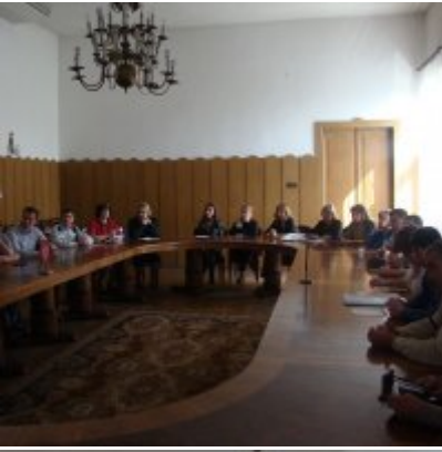
Delegacja z Ukrainy w Zatorze