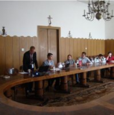
Delegacja z Ukrainy w Zatorze