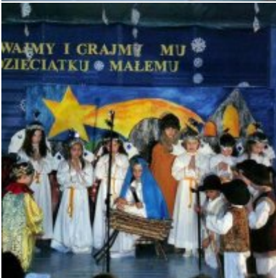
Przegląd Przedstawień Jasełkowych - Podolsze 2006