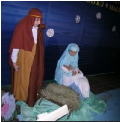
Przegląd Przedstawień Jasełkowych - Podolsze 2006