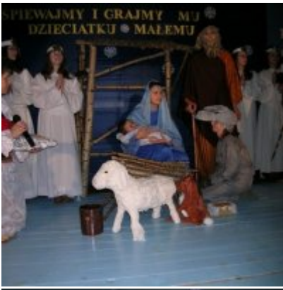
Przegląd Przedstawień Jasełkowych - Podolsze 2006