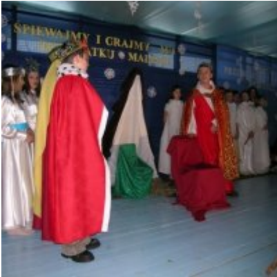
Przegląd Przedstawień Jasełkowych - Podolsze 2006