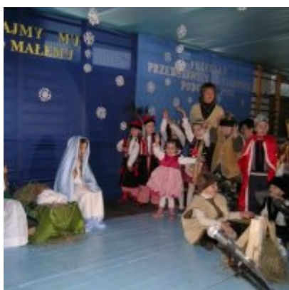
Przeгляд Przedstawień Jasełkowych - Podolsze 2006