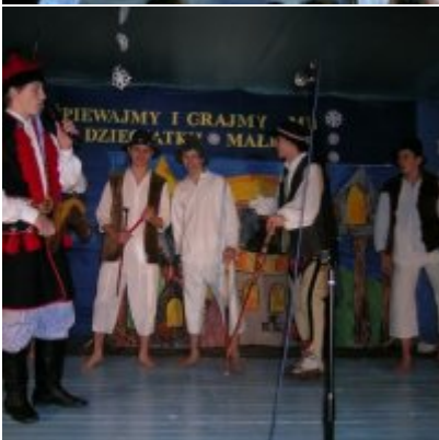
Przegląd Przedstawień Jasełkowych - Podolsze 2006