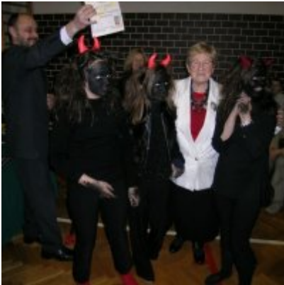
Przegląd Przedstawień Jasełkowych - Podolsze 2006