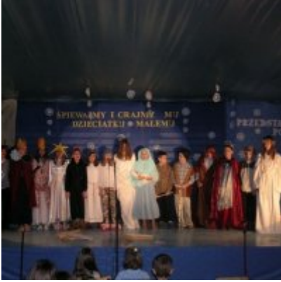
Przegląd Przedstawień Jasełkowych - Podolsze 2006