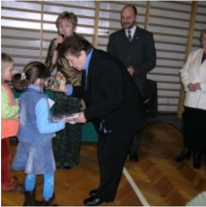
Przegląd Przedstawień Jasełkowych - Podolsze 2006