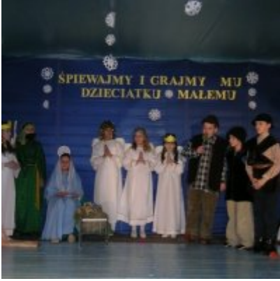
Przegląd Przedstawień Jasełkowych - Podolsze 2006