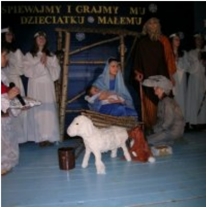
Przegląd Przedstawień Jasełkowych - Podolsze 2006