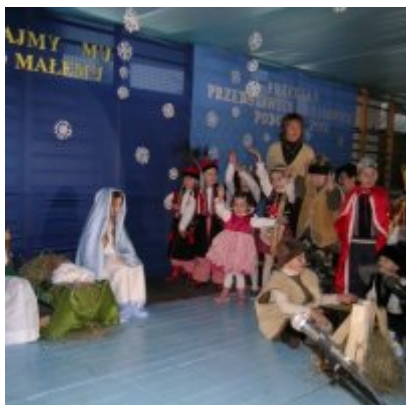
Przegląd Przedstawień Jasełkowych - Podolsze 2006