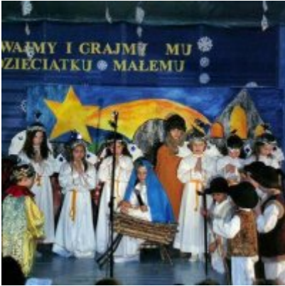
Przegląd Przedstawień Jasełkowych - Podolsze 2006