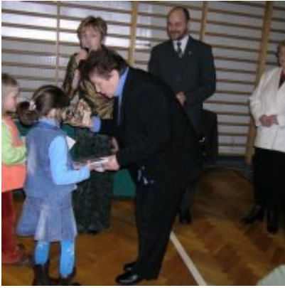
Przegląd Przedstawień Jasełkowych - Podolsze 2006