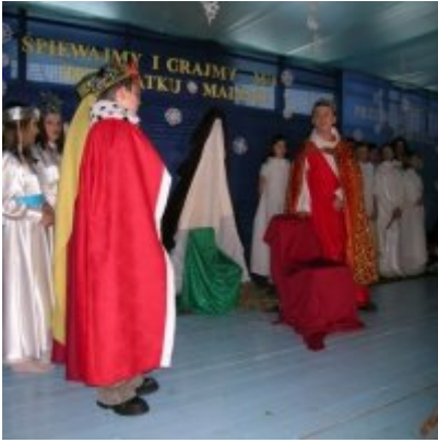
Przegląd Przedstawień Jasełkowych - Podolsze 2006