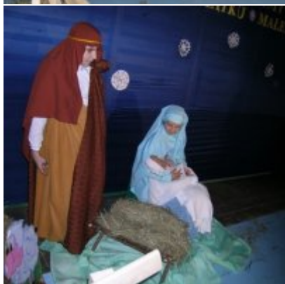
Przegląd Przedstawień Jasełkowych - Podolsze 2006