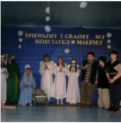
Przegląd Przedstawień Jasełkowych - Podolsze 2006