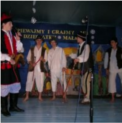
Przegląd Przedstawień Jasełkowych - Podolsze 2006