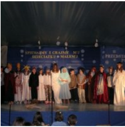
Przegląd Przedstawień Jasełkowych - Podolsze 2006