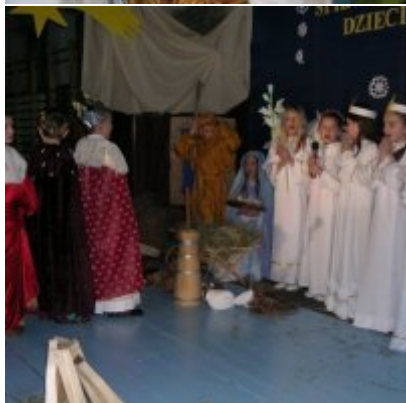
Przegląd Przedstawień Jasełkowych - Podolsze 2006