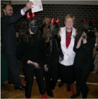
Przegląd Przedstawień Jasełkowych - Podolsze 2006