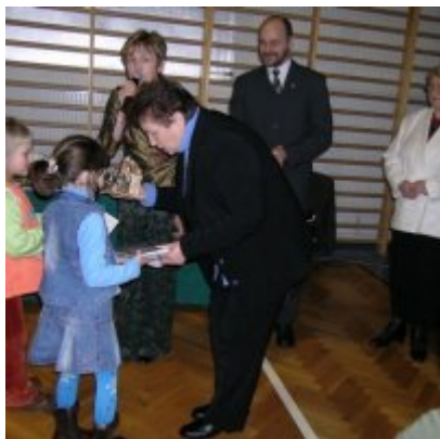
Przeгляд Przedstawień Jasełkowych - Podolsze 2006