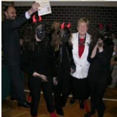
Przeгляд Przedstawień Jasełkowych - Podolsze 2006