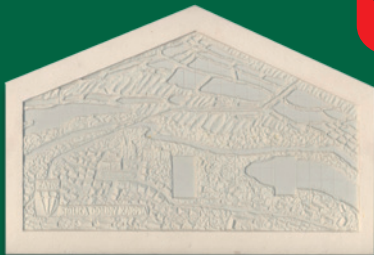
Ratusz Miejski - PŁASKORZEŻBA