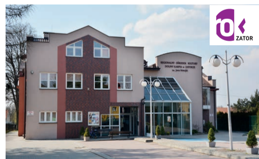
17 Regionalny Ośrodek Kultury

Energylandia to najnowocześniejszy i największy park rozrywki w Polsce. Jest to potężny kompleks, w którym na ogromnej przestrzeni 35 ha znajduje się mnóstwo atrakcji, w tym aż 15 roller coasterów. Flagowymi atrakcjami parku są: Hyperion – najwyższy w Europie mega coaster, którego spadek pod kątem 85 stopni z 80 metrów z prędkością 142 km/h zapewnia ekstremalne doznania. Liczne zwroty, panoramiczna fala oraz efekty grawitacyjne nie pozwalają o sobie zapomnieć na bardzo długo! Drugą Top atrakcją jest Zadra – największy na świecie wooden coaster. Hybrydowa konstrukcja wznosi nas na wysokość aż 63 m, a wagonik pędzi z zawrotną prędkością 121 km/h. Park podzielony jest na kilka stref tematycznych: Bajkolandia, Strefę Familijną, Strefę Ekstremalną oraz Park Wodny.