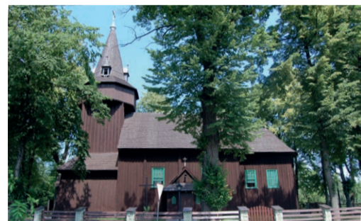
5 Kościół pw. św. Jakuba Apostoła w Palczowicach

Ten drewniany kościół stanowi jeden z najcenniejszych zabytków drewnianego budownictwa sakralnego na pograniczu śląsko-małopolskim. Wybudowany prawdopodobnie około 1585 roku, w następnym stuleciu dobudowano wieżę, którą następnie podwyższono w XVIII wieku. Kościół znajduje się na Małopolskim Szlaku Architektury Drewnianej.