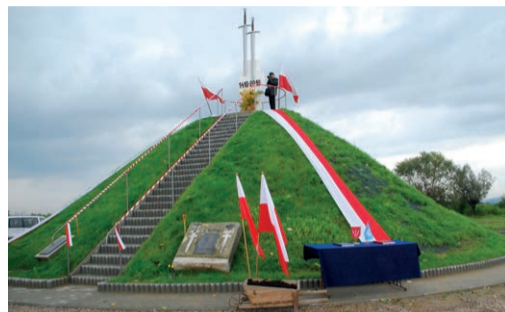
6 Kopiec Grunwald w Palczowicach

To dziewiętnastowieczny drewniany kościół położony w Palczowicach – w miejscu wcześniejszego z XV wieku. W okresie reformacji zamieniony przez Palczowskich na zbór kalwiński. Oprócz ołtarza głównego w kościele szczególnie ciekawe są dwa XVII-wieczne późnorenansowe ołtarze boczne.