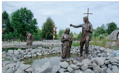
14 Park św. Andrzeja w Graboszycach

Centrum Aktywizacji Zawodowej. Nowoczesny obiekt edukacyjno-konferencyjny wybudowany przy wsparciu Polsko - Szwajcarskiego Programu Współpracy oraz środków Unii Europejskiej. Siedziba Wielozawodowego Zespołu Szkół - prowadzonej przez Gminę Zator szkoły średniej. W Centrum działa również Zatorski Inkubator Przedsiębiorczości, który wspiera firmy rozpoczynające działalność. W budynku organizowane są m.in. szkolenia, warsztaty, seminaria i konferencje biznesowe a także koncerty, spotkania i uroczystości.