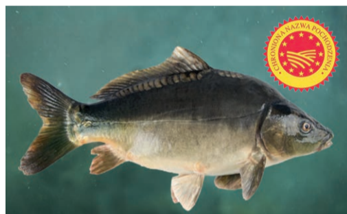
10 Karp Zatorski Chroniona Nazwa Pochodzenia

Turyści i mieszkańcy cenią sobie podróże rowerem wśród urokliwych rzek i stawów, siedlisk ptactwa i bujnej przyrody. Niezliczone gatunki ptaków przyciągają ornitologów i amatorów fotografowania zjawisk przyrody. Do najważniejszych szlaków i ścieżek rowerowych należy zaliczyć: Greenways – Kraków – Morawy – Wiedeń, Szlak Doliny Karpi, EuroVelo R4, Małopolski Szlak Architektury Drewnianej, IDENTUR, Dwa Zamki.