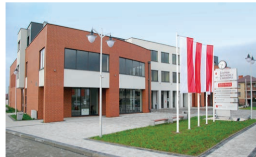
13 Centrum Aktywizacji Zawodowej