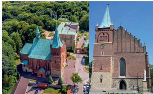
1 Kościół Parafialny pw. św. Wojciecha i Jerzego w Zatorze