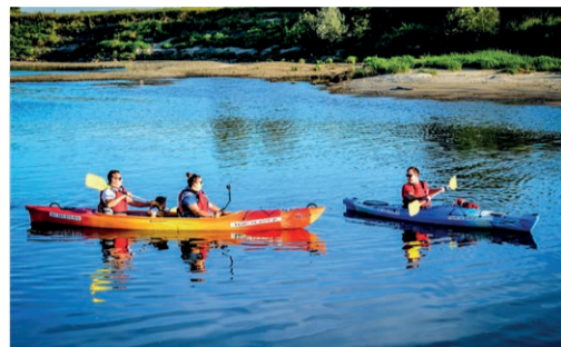
8 Splywy kajakowe na Skawie i Wiśle

Już od XVII wieku mieszkańcy zatorszczyzny otaczali św. Rocha wielką czcią, kierując do niego swoje modlitwy i prośby. O jego opiekę zwracali się zawsze w podróży, w chwilach ciężkich chorób, a zwłaszcza w czasach epidemii i nieszczęść spowodowanych groźnymi chorobami zakaźnymi. Dekretem Kongregacji ds. Kultu Bożego i Dyscypliny Sakramentów Stolicy Apostolskiej na prośbę mieszkańców w 2019 roku św. Roch został patronem Miasta i Gminy Zator.