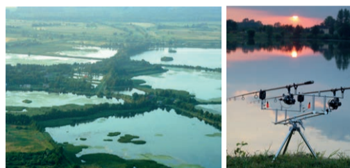
11 Kompleksy zatorskich stawów rybnych Łowiska wędkarskie

Karp zatorski – najbardziej znany polski karp To produkt wyróżniający i promujący Dolinę Karpi. Karp zatorski to najpopularniejsza odmiana karpia w Polsce. Mówi się o niej „królewska”, bowiem historia karpia z gminy Zator, sięga XI wieku, kiedy to karp z Zatora trafiał na królewskie stoły na Wawelu.