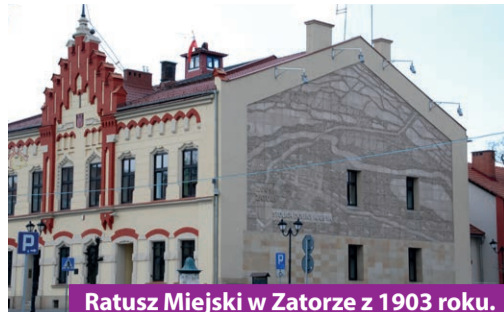
3 Ratusz Miejski w Zatorze z 1903 roku. Płaskorzeźba „Panorama Gminy Zator – Stolica Doliny Karpi”

To niezwykle cenny i wartościowy zabytek Doliny Karpi. Pierwotnie zamek książęcy o cechach obronnych z ok 1445 r, siedziba książąt zatorskich z górnośląskiej linii piastowskiej, później starostów. W 1778 roku zakupiony przez Duninów i częściowo przebudowany z budową drugiego piętra. W latach 1964-1973 gruntownie odnowiony. Na parterze znajdują się bogato zdobione sale. Obecnie w remoncie.