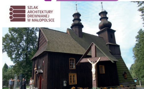
4 Kościół parafialny pw. św. Andrzeja Apostoła w Graboszycach