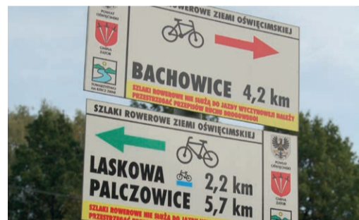
9 Szlaki nordic walking oraz trasy rowerowe

Coraz większą popularność zyskują indywidualne oraz grupowe splywy kajakowe na rzece Skawie z trasami kończącymi się m.in. w Grodzisku, Zatorze, a także na rzece Wiśle zaczynające się w Smolicach. Szczegóły na stronach: http://kajaki-na-skawie.pl i http://kajaki-na-wisle.pl . Zapraszamy również w maju na coroczny Ogólnopolski Splyw Kajakowy na Skawie organizowany przez Śląski Klub Turystyki Kajakowej „Neptun”.