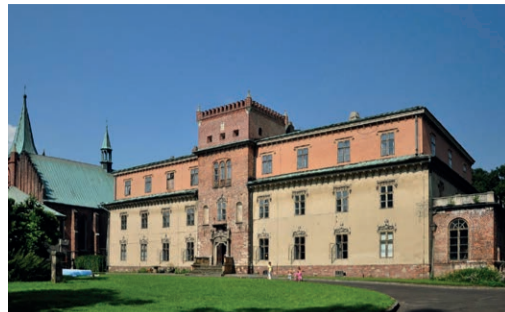
2 Zamek Książęcy w Zatorze z XV wieku