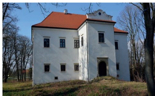
12 Gotycko-renesansowy dwór obronny w Graboszycach z XVI w.

To najcenniejsze przyrodniczo tereny Doliny Karpi. Obszar ten to historyczny ośrodek hodowli karpia znanego już w średniowieczu. Stawy hodowlane, zajmują obszar setek hektarów, rozciągając się w dolinie Wisły, Skawy i Wieprzówki. Do największych kompleksów hodowlanych Karpi Zatorskiego należą gospodarstwa: Przyręb, Spytkowice, Bugaj, Rudzie i Laskowa. Dolina Karpi, dzięki licznym łowiskom wędkarskim zwana jest „Mazurami Małopolski”. Jest to idealne miejsce do aktywnego wypoczynku, zwłaszcza na łowiskach znajdujących się na „Szlaku Karpi”. Do najatrakcyjniejszych należą m.in.: Łowisko Tęczak w Trzebieńczycach, Łowisko Podolsze, Łowiska w Graboszycach, Łowiska Staw Duży i Staw Mały, Łowisko Zakole A i Zakole B.