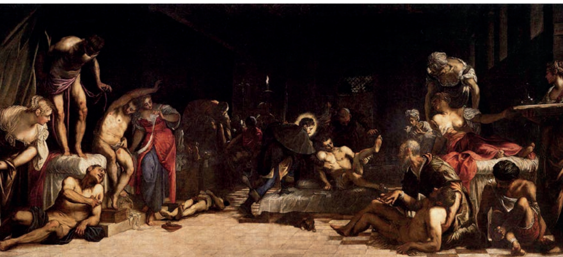
Jacopo Tintoretto, Św. Roch w szpitalu, 1549, Scuola Grande di San Rocco, Wenecja.