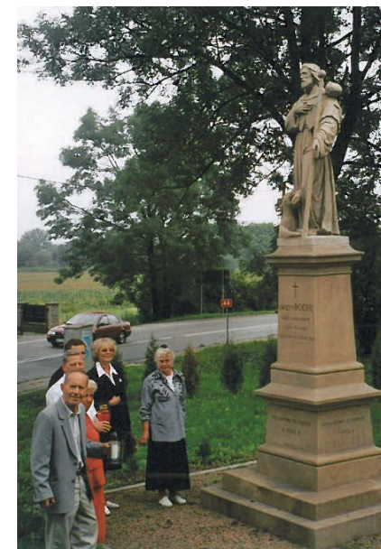
Odnowienie figury św. Rocha, 2003 rok. Na zdjęciu: przedstawiciele Towarzystwa Miłośników Ziemi Zatorskiej i Rady Społecznej Odnowy Zatorskich Zabytków.