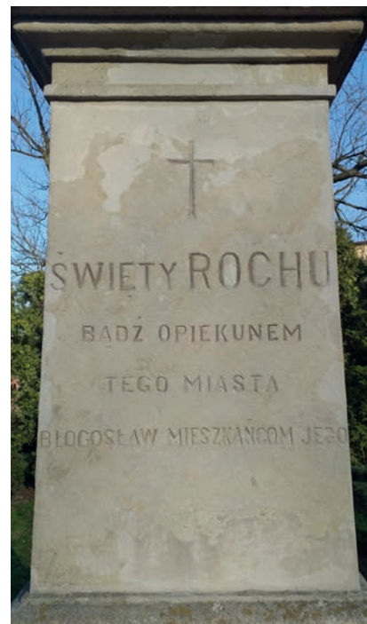
Napis na postumencie pomnika św. Rocha.