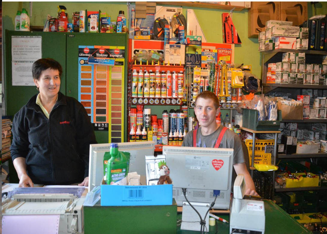
Sprzedawca-magazynier w Market Budowlany „Jeżyk” w Polance Wielkiej