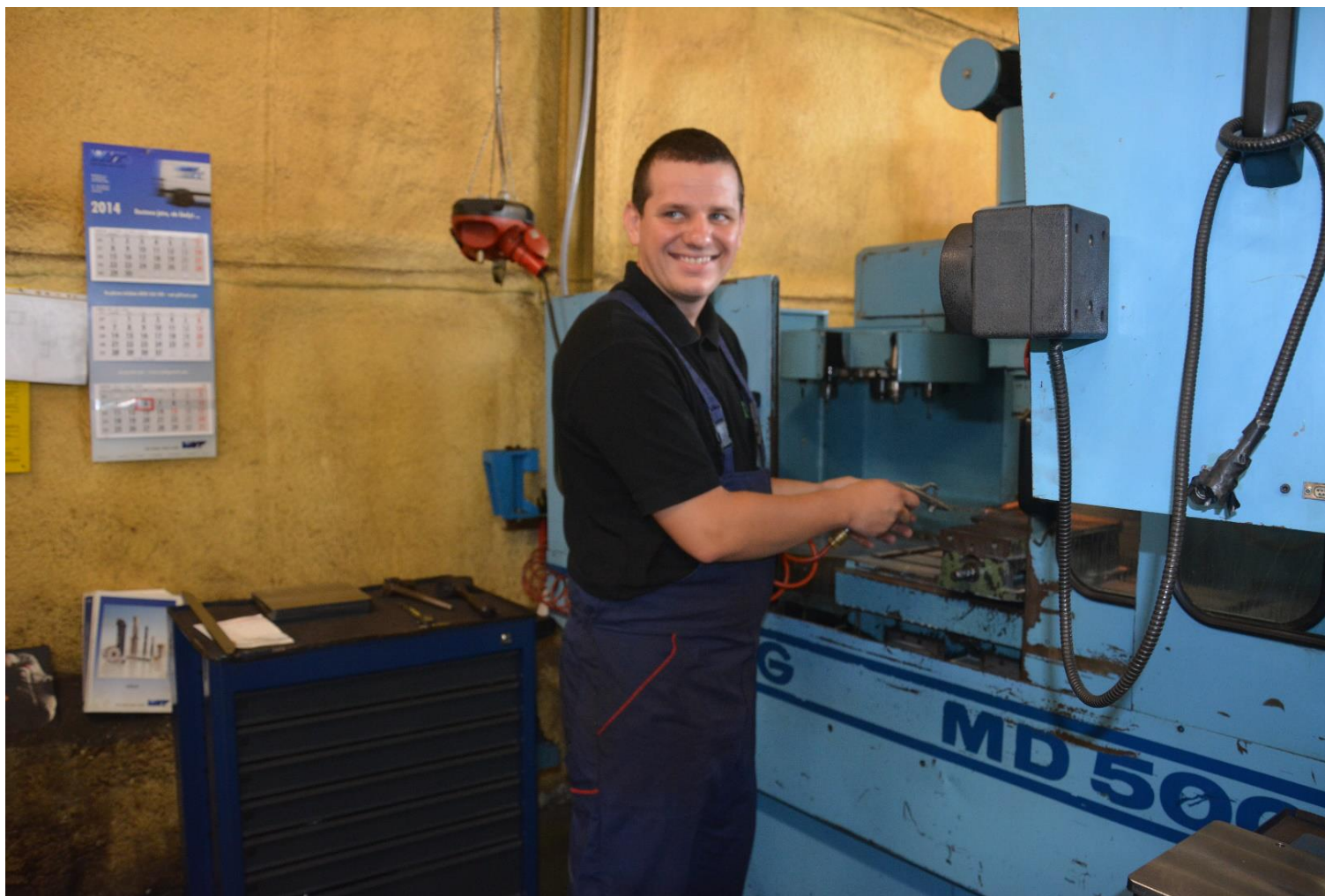
Operator CNC – pionowe centrum frezarskie – Multiserw w Marcyporębie