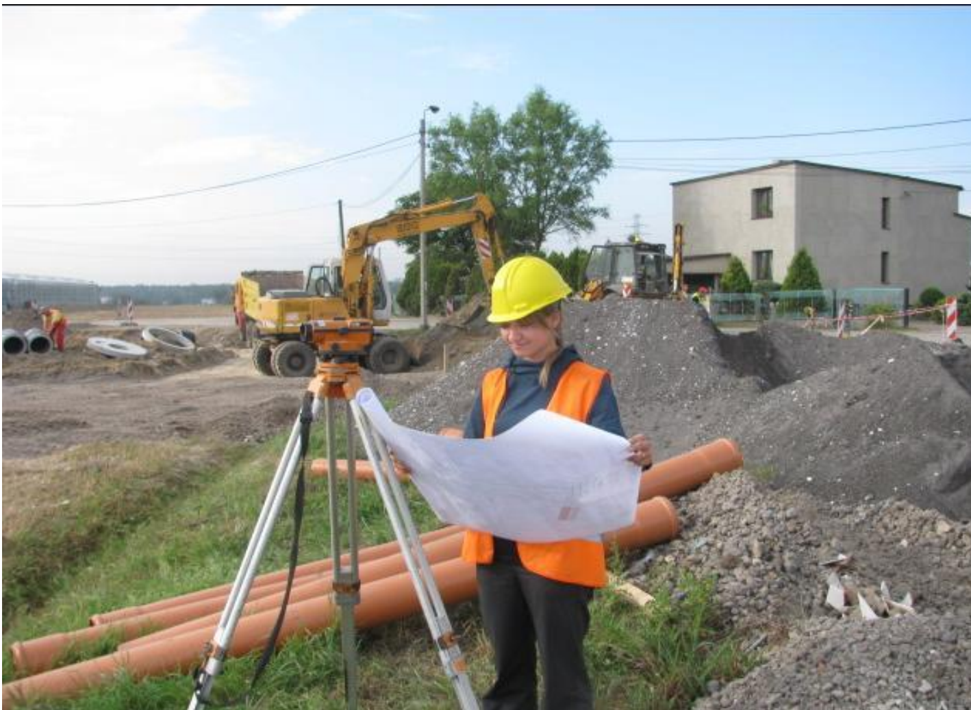
Zakład Budowlano- Inżynieryjny w Preciszowie / Asystentka kierownika robót