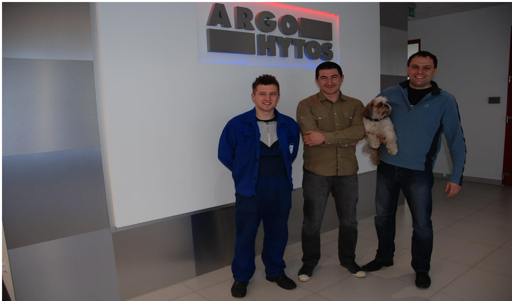
Asystent inżyniera produkcji w Argo Hytos Polska sp. z. o.o. w Zatorze