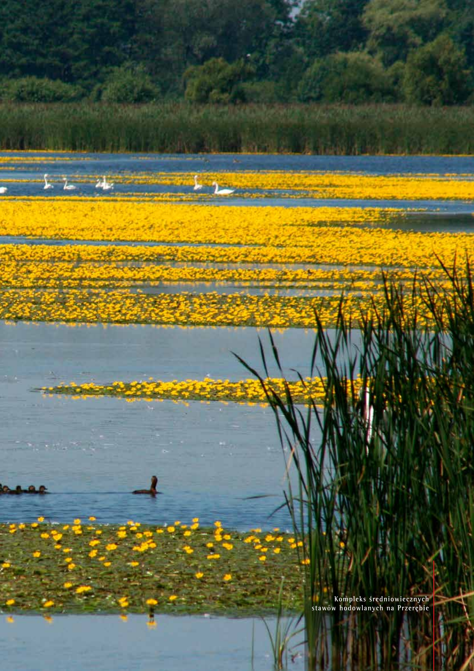
Kompleks średniowiecznych stawów hodowlanych na Przerębie