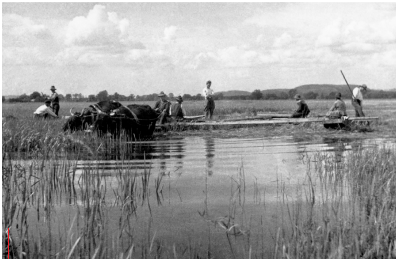
Koszenie stawów z wykorzystaniem maszyn ciągniętych przez woły. Zdjęcie z okresu międzywojennego.

Po napaści Niemiec hitlerowskich na Polskę, Zator został włączony do Rzeszy. Na przepływającej przez miasto Skawie, przebiegała granica ustanowiona przez Niemców, pomiędzy terenami włączonymi do Rzeszy, a Generalnym Gubernatorstwem,