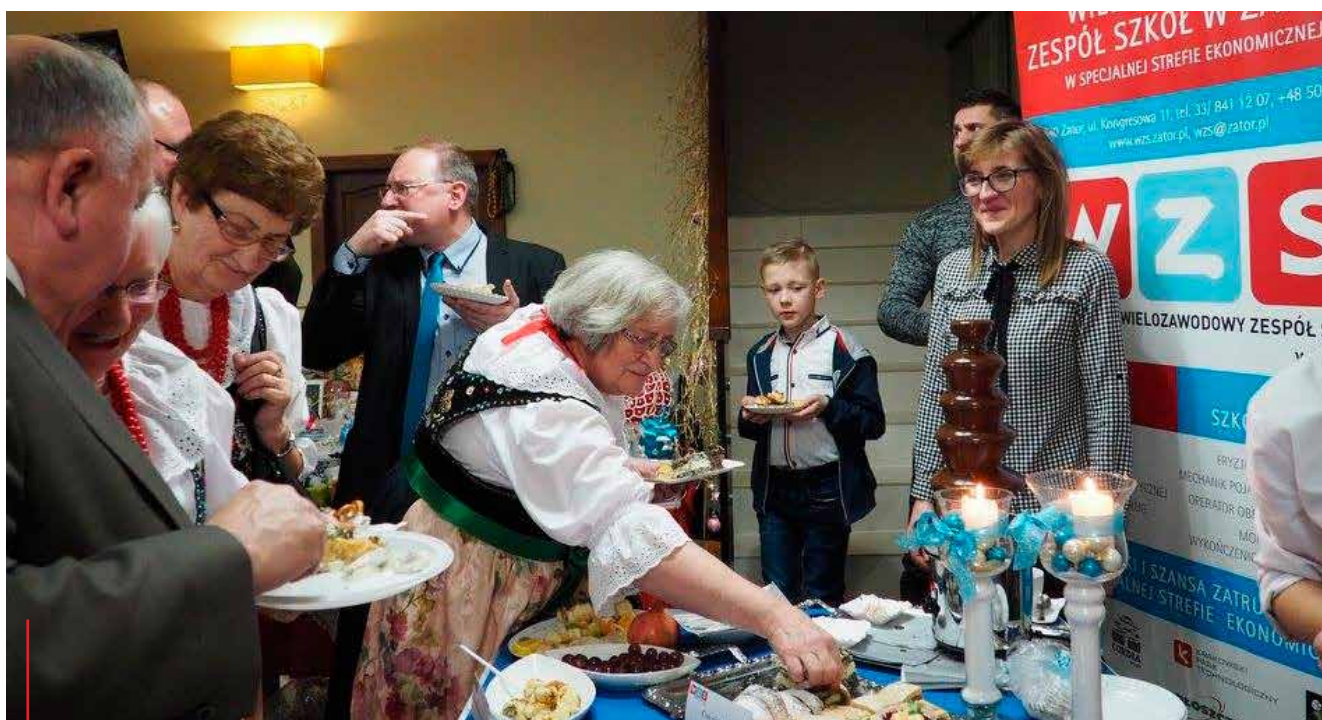
Na wszystkich prezentacjach kulinarnych stoiska przygotowane przez uczniów klasy gastronomicznej zatorskiego WZS cieszą się zawsze dużym powodzeniem.

Obok szkół i przedszkoli funkcjonują nowe place zabaw, z których bardzo chętnie korzystają najmłodszy.