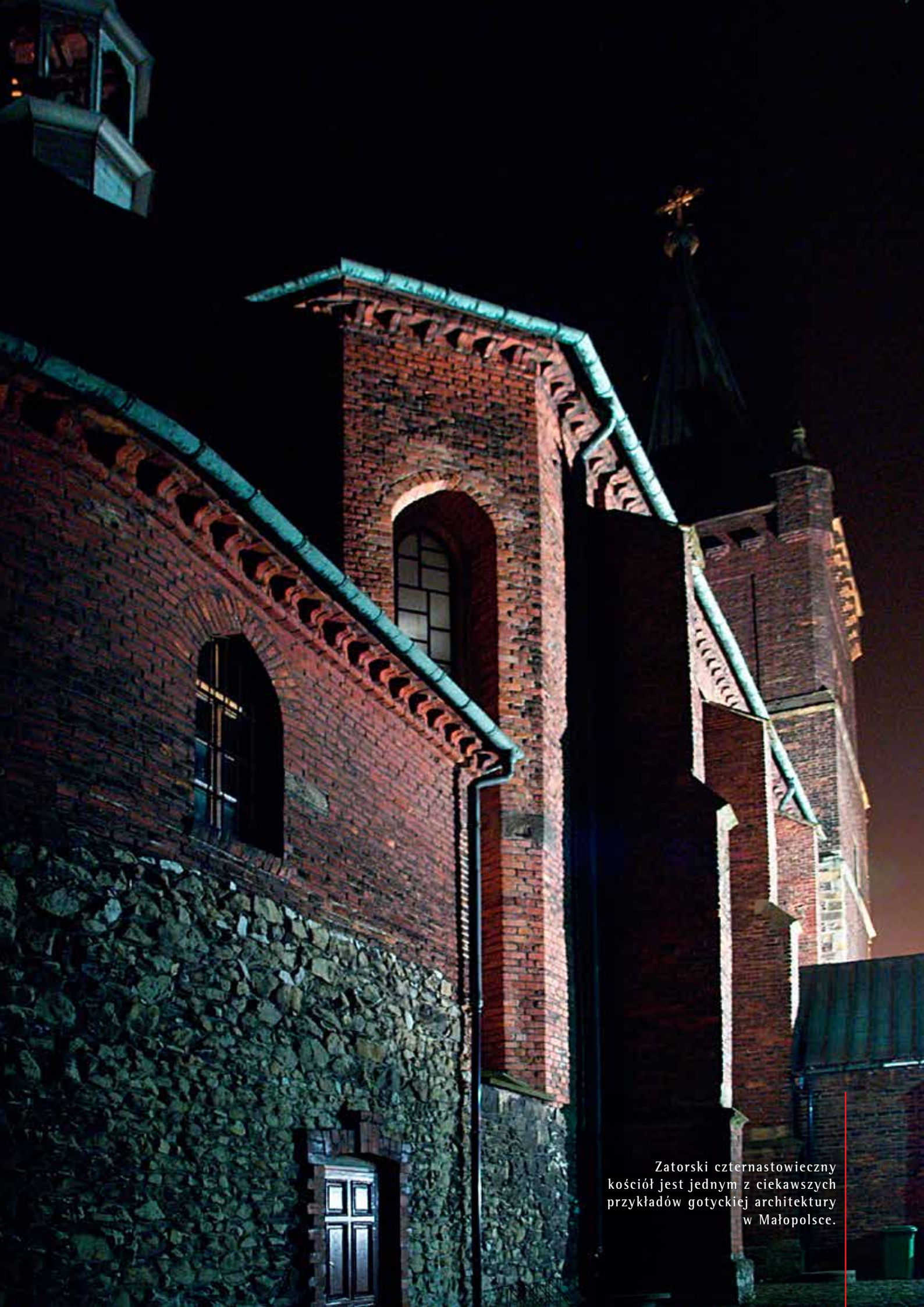
Zatorski czternastowieczny kościół jest jednym z ciekawszych przykładów gotyckiej architektury w Małopolsce.