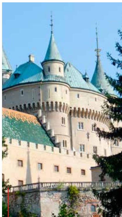
W słowackich Bojnicach znajduje się zamek uznany za jeden z trzech najładniejszych zamków Europy