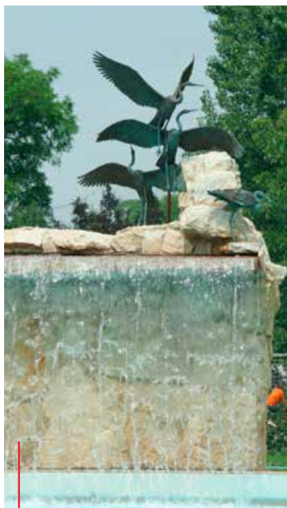
Węgierskie Berekfürdo, to pierwsza miejscowość partnerska Zatora. Tamtejsze baseny termalne przyciągają tysiące turystów z całej Europy.

mentalnych, Sokolników i pokaz fire show z Bojnic, na długo pozostaną w pamięci Zatorzan uczestniczących w Świącie Karpia. Natomiast folklorystyczne zespoły z Terchowej oraz produkty regionalne z tej części Słowacji są dużą atrakcją podczas wielu imprez plenerowych w Zatorze. W czasie tej wieloletniej współpracy nawiązały się także już mniej sformalizowane kontakty i wielu mieszkańców gminy w wyniku współpracy pomiędzy szkołami gościło u siebie młodych ludzi ze Słowacji i odwiedziło z rewizytą piękne słowackie miasta.