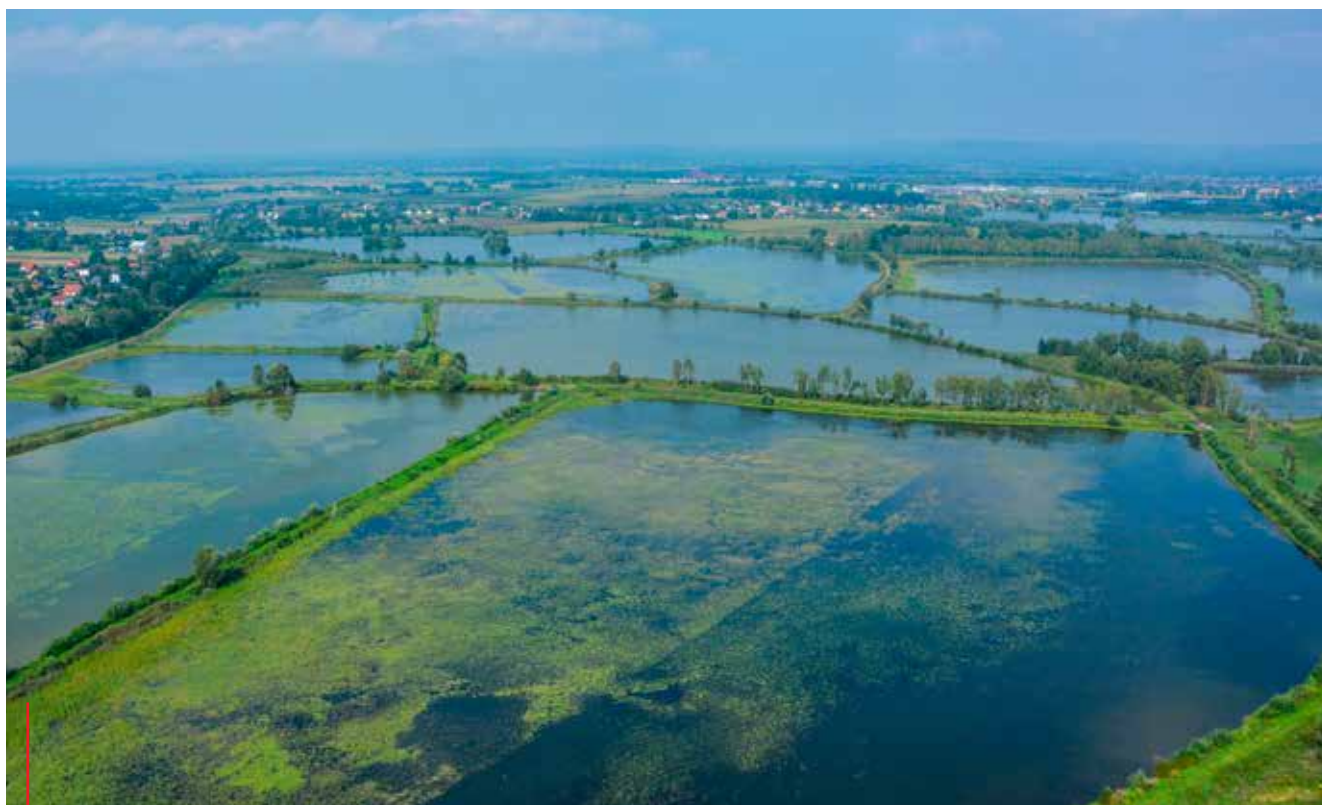
Charakterystyczny dla gminy krajobraz. Zatorskie stawy.

lokalne. W każdej wsi bardzo aktywnie działają Koła Gospodyń Wiejskich, a w Rudzach i Trzebieńczycach funkcjonuje także koło gospodarzy. Podczas każdej plenerowej imprezy, to właśnie dzięki ich zaangażowaniu, turyści mogą kosztować specjalów lokalnej kuchni, a szczególnie potraw z zatorskiego karpia. Koła są także organizatorami wielu innych działań społecznych i kulturalnych. O pamięć o historii małej ojczyzny, dba natomiast Towarzystwo Miłośników Ziemi Zatorskiej, które gromadzi pamiątki z przeszłości miasta, prowadzi izbę regionalną, a także organizuje wiele dodatkowych projektów propagu-