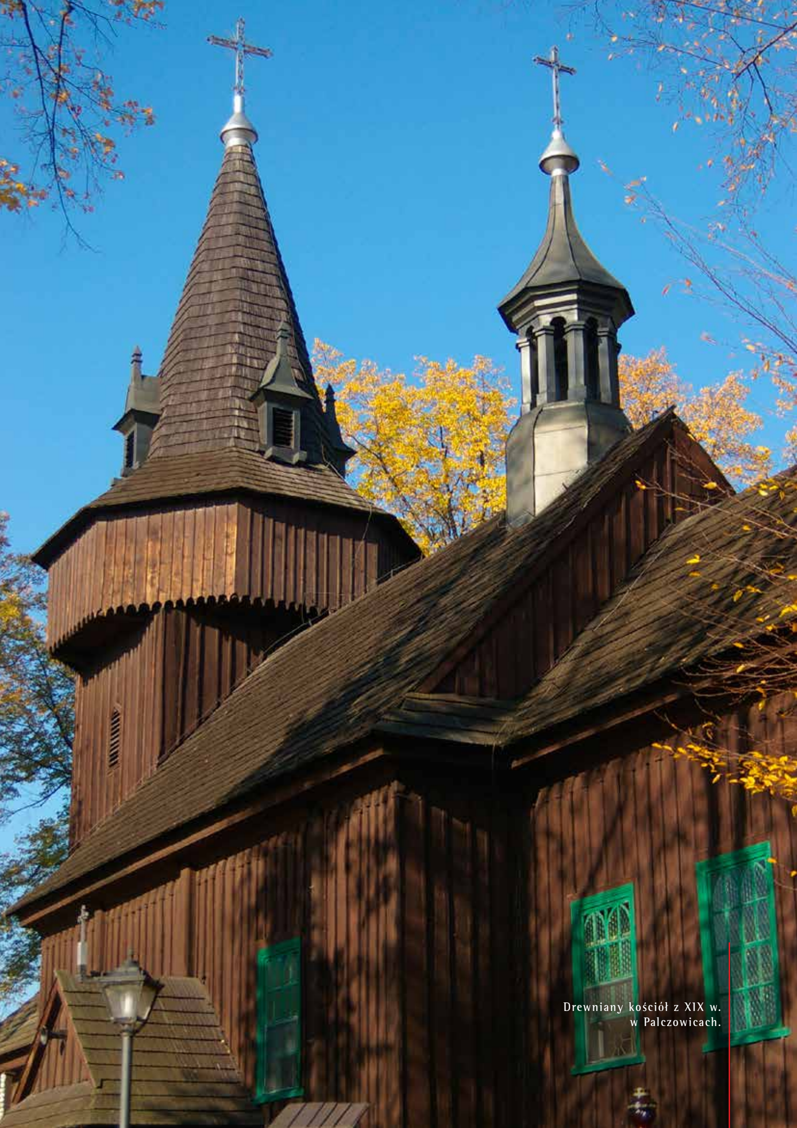
Drewniany kościół z XIX w. w Palczowicach.