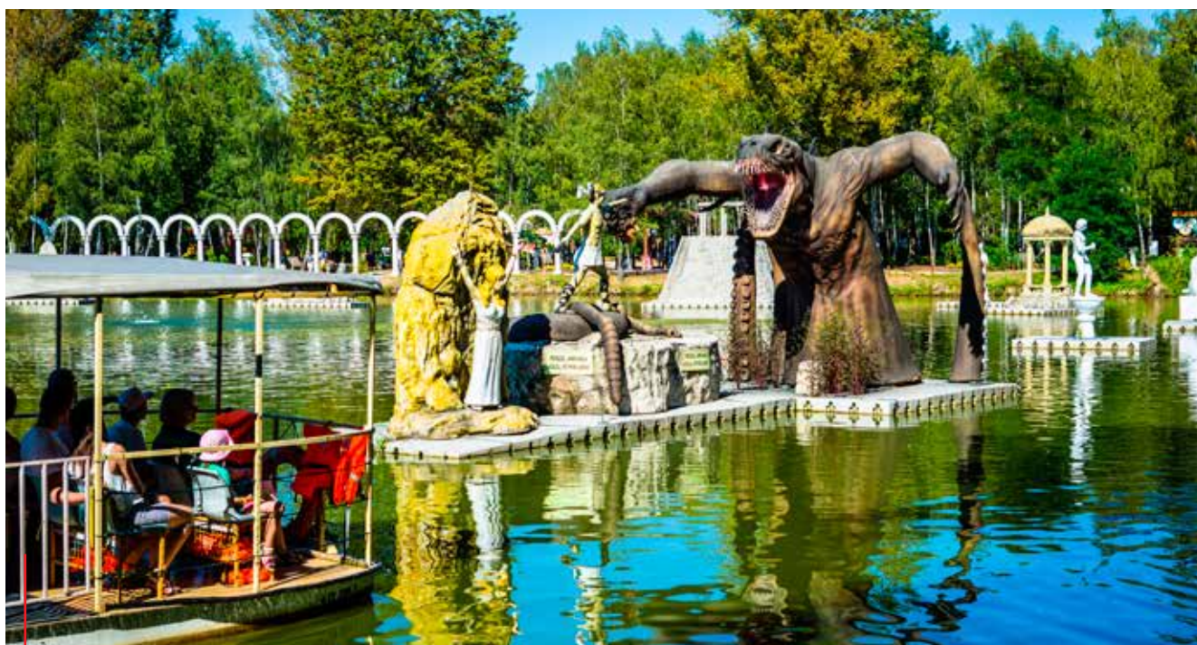
Zatorland - kompleks kilku parków rozrywki. Na zdjęciach park dinozaurów i park mitologii.

Swoją bardzo duży udział w rozwoju ma przede wszystkim Stowarzyszenie Dolina Karpia oraz Lokalna Grupa Działania, które od kilku lat zdobywają pieniądze z programów pomocowych Unii Europejskiej na działania realizowane na tym terenie.