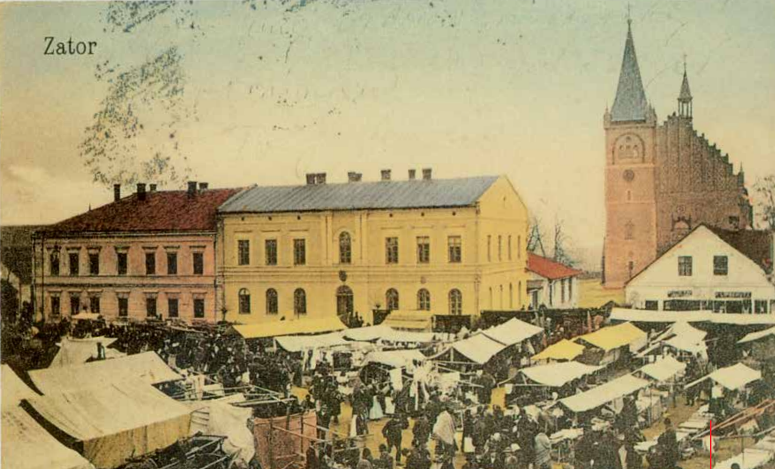
Targi na zatorskim rynku odbywały się już w średniowieczu. Ten uwieczniony na karcie pocztowej z czasów galicyjskich. Żółty budynek to sąd grodzki. Obecnie mieści się w nim siedziba Towarzystwa Miłośników Ziemi Zatorskiej i Stowarzyszenie „Dolina Karpią”.

tworem administracyjnym stworzonym z pozostałych terenów okupowanych przez hitlerowców. W okresie wojny ucierpiał bogaty księgozbiór i pamiątki narodowe, które pozosta-