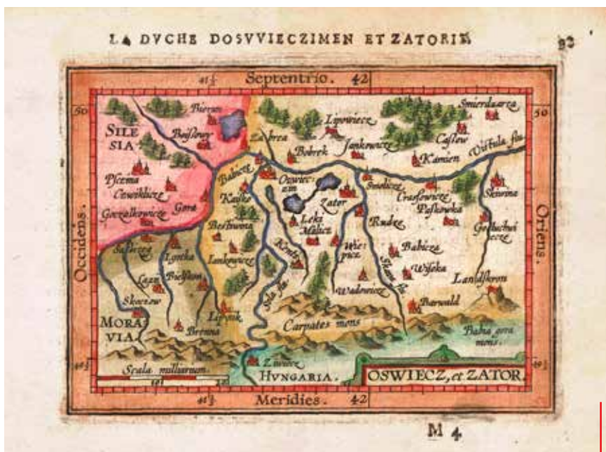
Mapa księstwa oświęcimsko-zatorskiego z XVI wieku. Zator z zaznaczonym zamkiem książęcym.