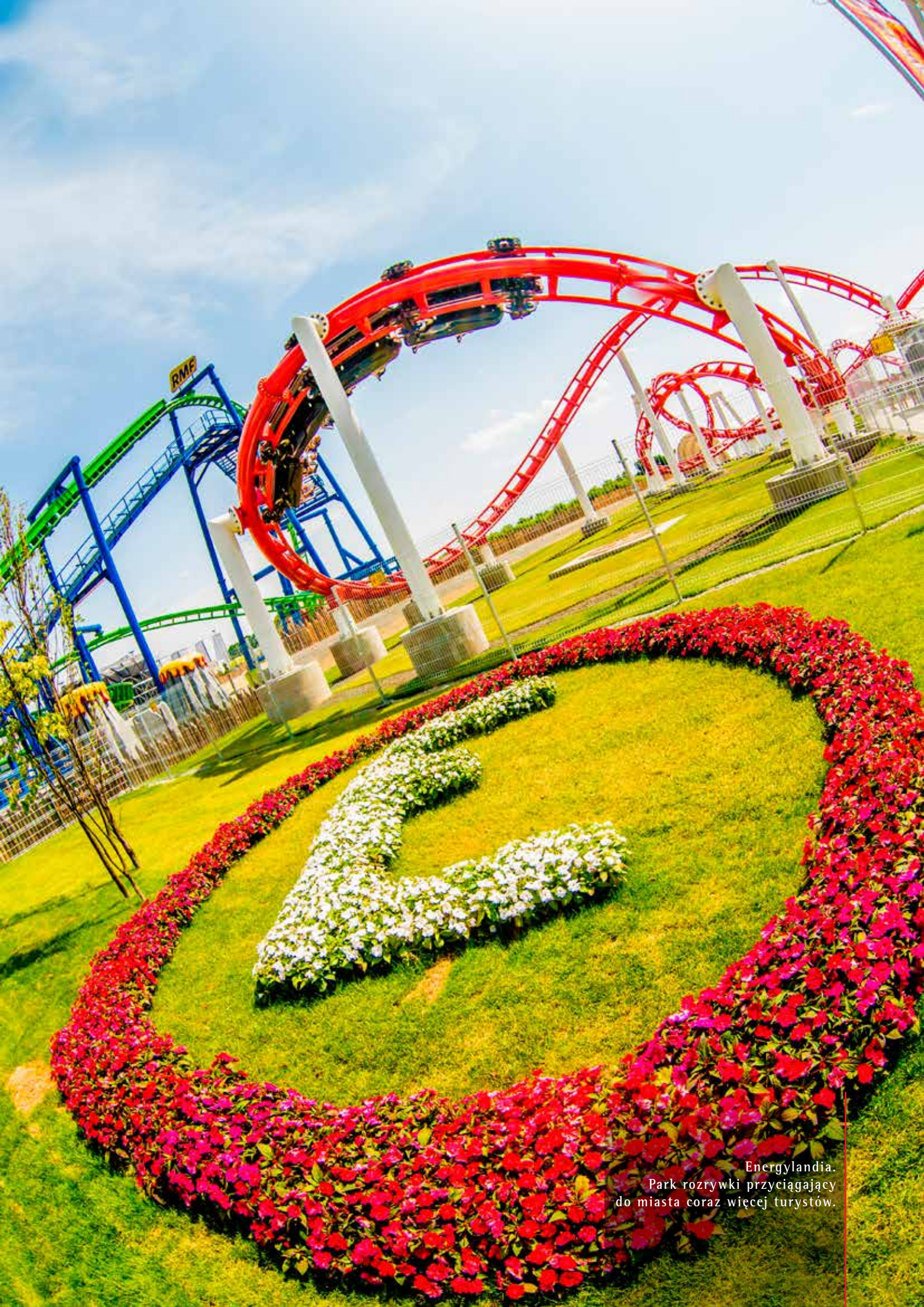
Energylandia. Park rozrywki przyciągający do miasta coraz więcej turystów.