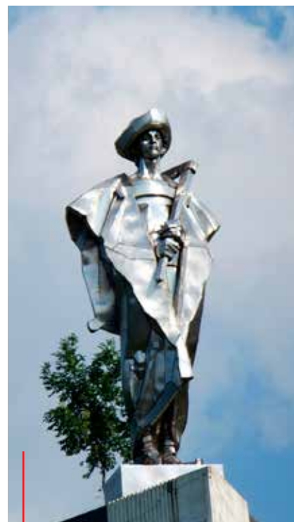
Pomnik Janosika w Terchowej, mieście partnerskim Zatora. Terchowska muzyka ludowa jest wpisana na listę Światowego Dziedzictwa UNESCO