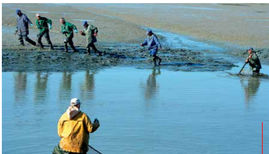
Odłowy Karpia Zatorskiego.

Z jednego hektara stawu można wyhodować nawet do 1 tony karpia. Razem z nimi hoduje się także inne ryby. W zatorskich stawach znaleźć można cenione przez wędkarzy sumy i szczupaki oraz karasie, liny, amury, tołpygi, jazie i okonie. Duża powierzchnia stawów jest również znakomitym siedliskiem dla ptaków i innych zwierząt, dzięki czemu tereny te posiadają znakomite walory przyrodniczo-turystyczne.