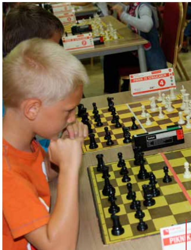
Obok tradycyjnych sportów w Zatorze organizowane są turnieje szachowe i mistrzostwa scrablistów.