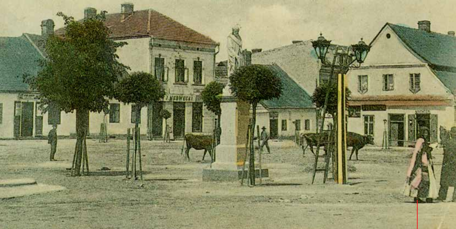
Zatorski rynek na karcie pocztowej z pocz. XX w.

Przez te tereny prowadził tzw. trakt oświęcimski, wiodący na Śląsk oraz trakt krakowski do ówczesnej stolicy Polski, Krakowa. Przez miasto wiodła jeszcze jedna trasa kupiecka – prowadząca do tzw. drogi miedziowej w Kętach, skąd kupcy podróżowali dalej w stronę Bielska, Cieszyna i na Morawy.