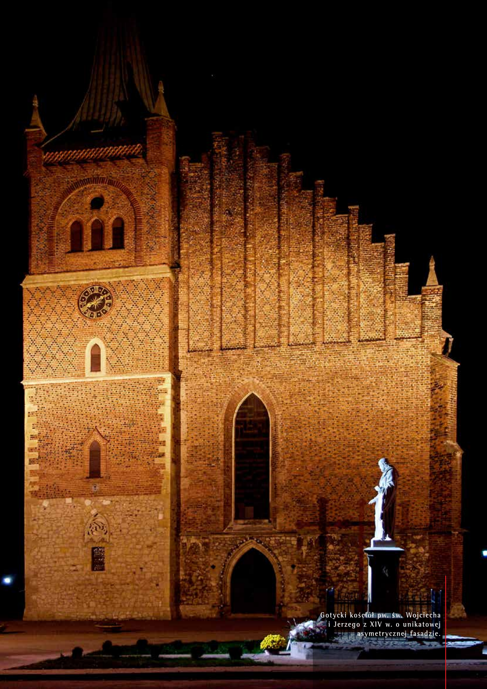
Gotycki kościół pw. św. Wojciecha i Jerzego z XIV w. o unikatowej asymetrycznej fasadzie.