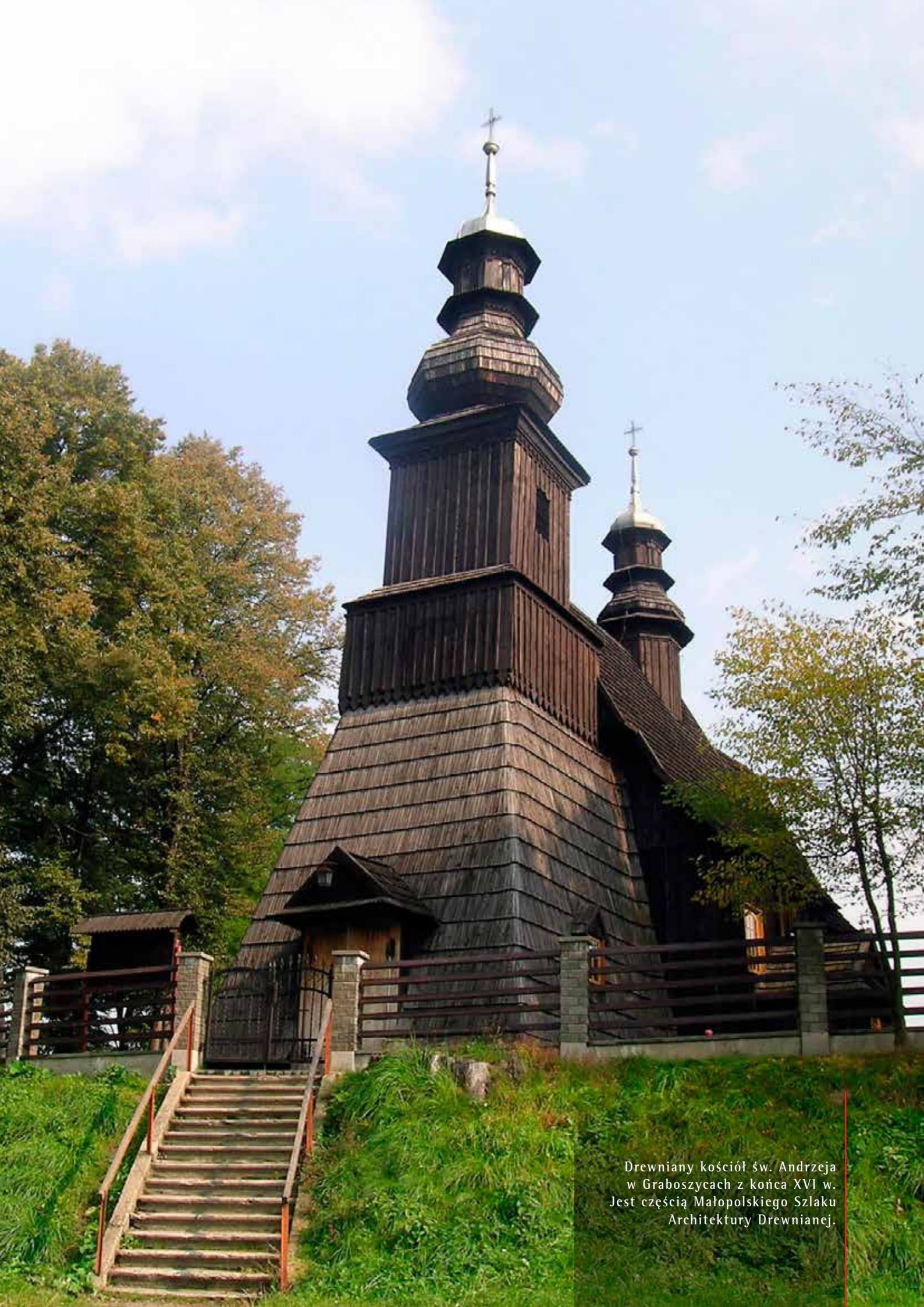
Drewniany kościół św. Andrzeja w Graboszycach z końca XVI w. Jest częścią Małopolskiego Szlaku Architektury Drewnianej.