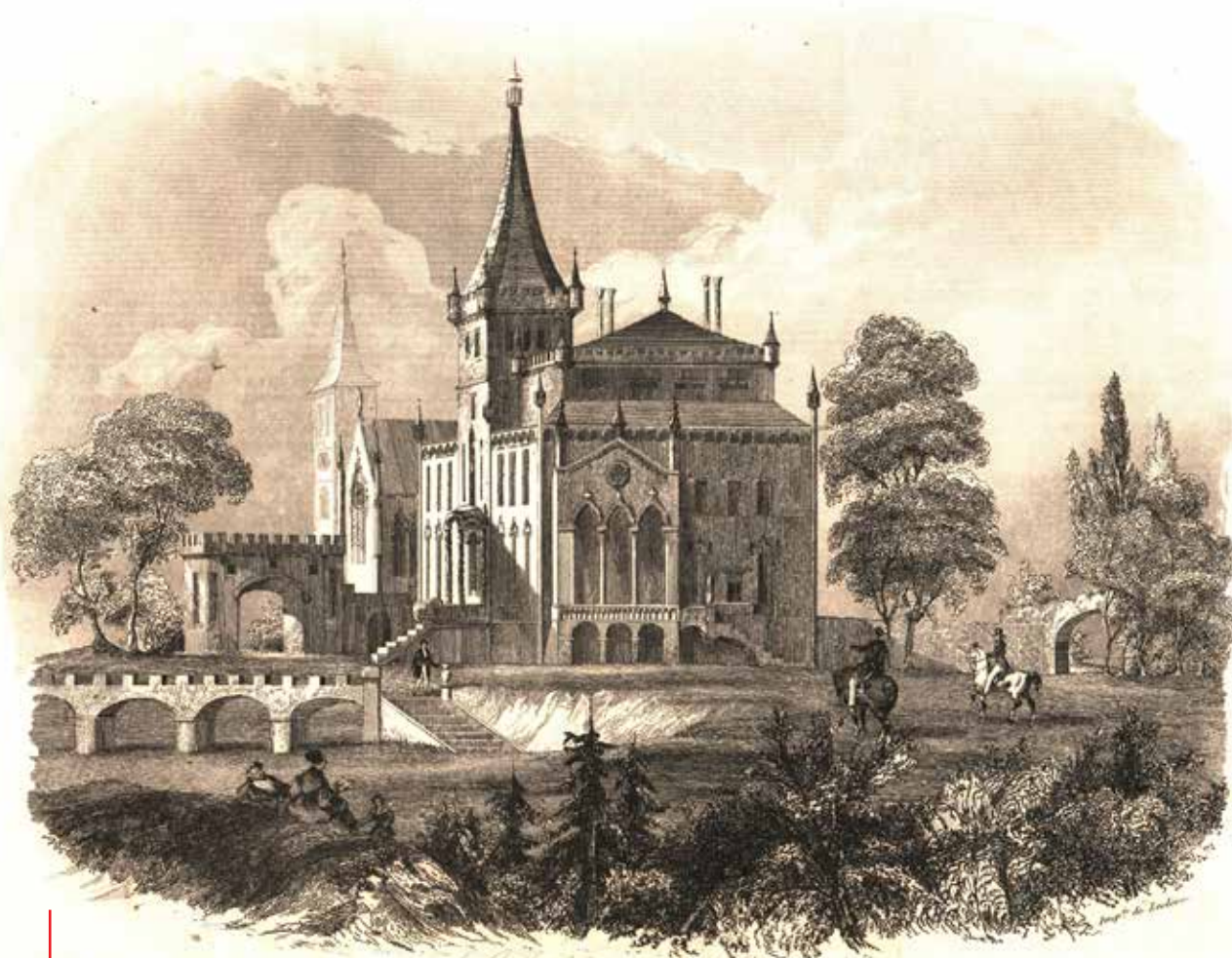
Zamek książęcy w Zatorze. Rycina z pocz. XIX w. Obecnie po przebudowach zamek (pałac) nie posiada tyłu zdobień fasad.

-oświęcimskie, w granicach którego leżał Zator. Przełomową datą w historii Zatora był rok 1292, wtedy to książę Cieszyna i pan Oświęcimia Mieszko I, nadał Zatorowi prawa miejskie, czyli w 2017 roku Zator obchodzi 725. rocznicę funkcjonowania jako miasto. Zator był ważnym miejscem na szlaku kupieckim średniowiecznej Polski.