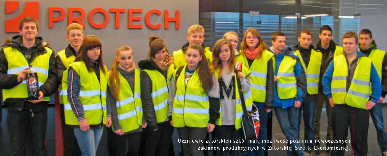
Uczniowie zatorskich szkół mają możliwość poznania nowoczesnych zakładów produkcyjnych w Zatorskiej Strefie Ekonomicznej.