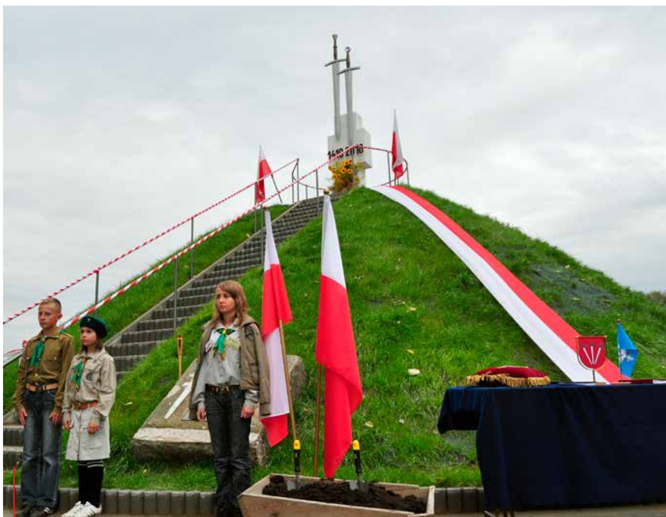
Kopiec Grunwaldzki w Palczowicach.

szczyt bieć będzie ścieżka okalająca pierścieniem cały kopiec. Budowa kopca zostanie sfinansowana wyłącznie z pieniędzy społecznych, a do jego budowy wykorzystana będzie ziemia z polskich pól bitewnych. Oba kopce połączy specjalny szlak turystyczny.