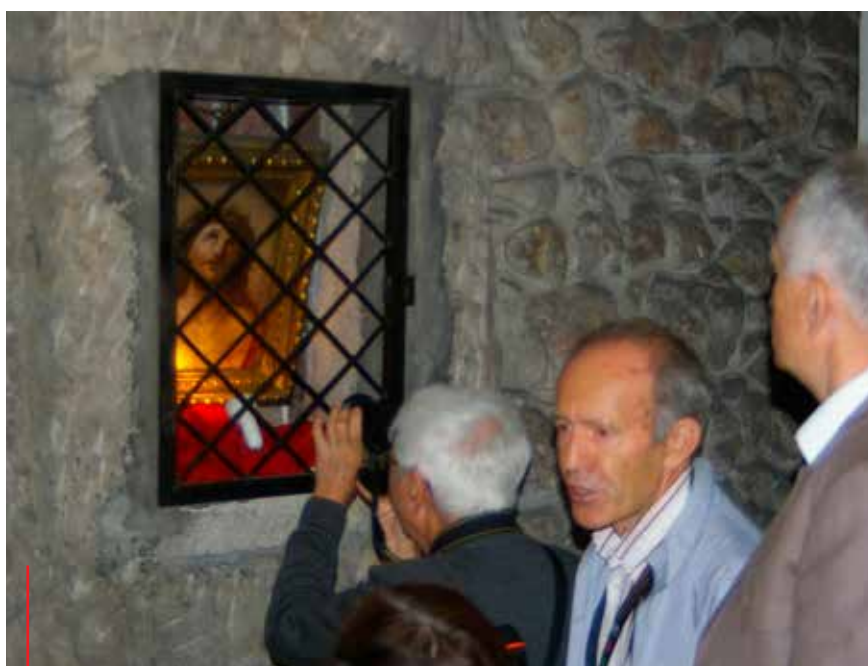
W prezbiterium kościoła znajduje się mozaika ECCE HOMO pochodząca z XVI w.