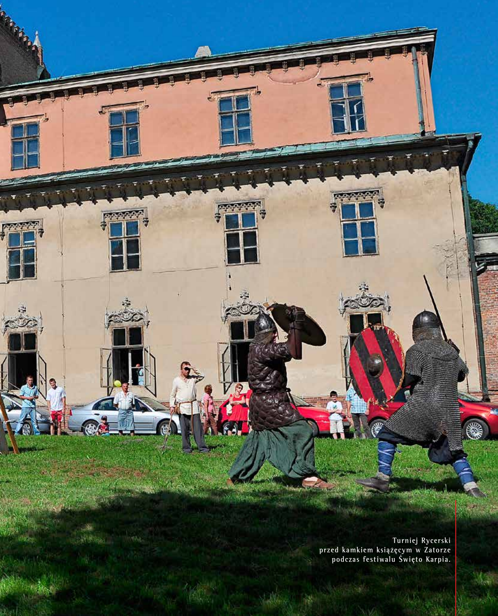
Turniej Rycerski przed kamieniem książęcym w Zatorze podczas festiwalu Święto Karpia.