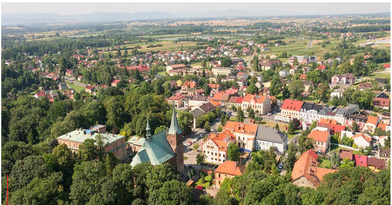
Panorama Zatora w kierunku zachodnim. Na pierwszym planie kościół i pałac.

Zator słynie także ze „Święta Karpia” i „Wielkich Zatorskich Żniw Karpiowych”,