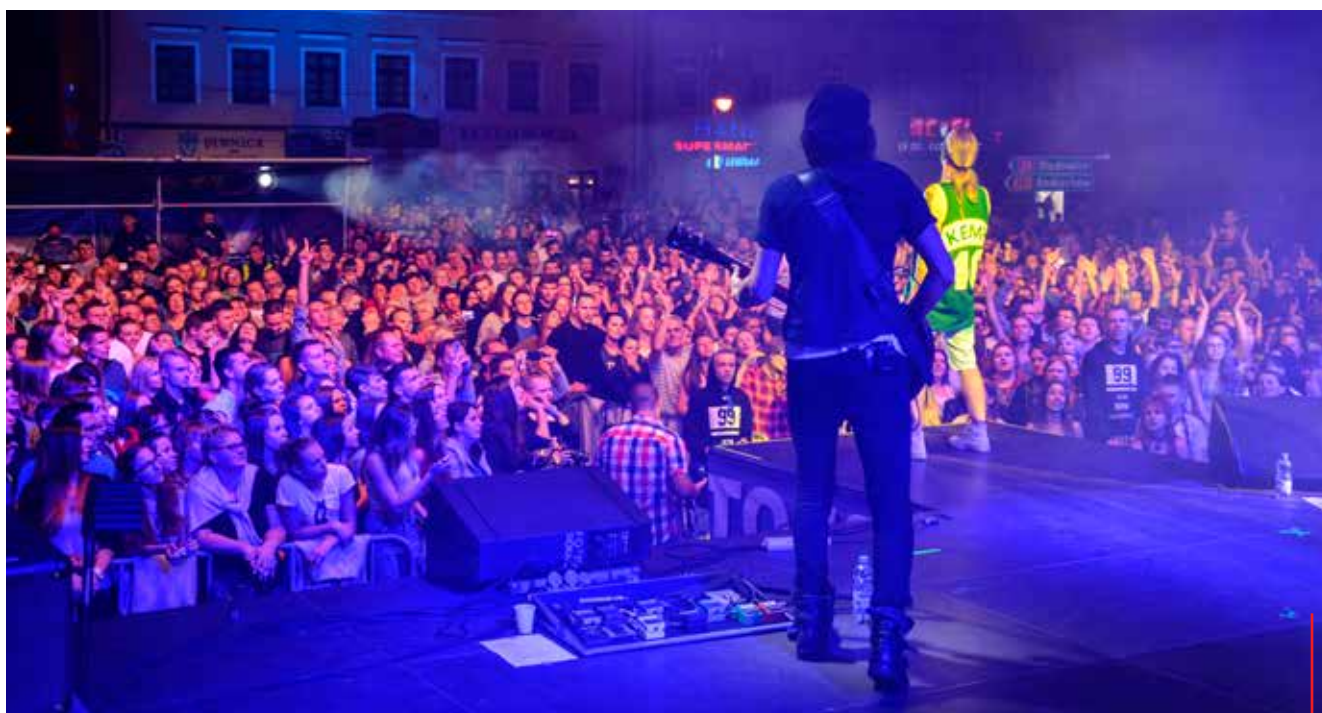
Zawsze na Święto Karpia odbywające się w lipcu na zatorskim rynku przyjeżdżają tysiące osób, nawet z dalekich miejscowości.