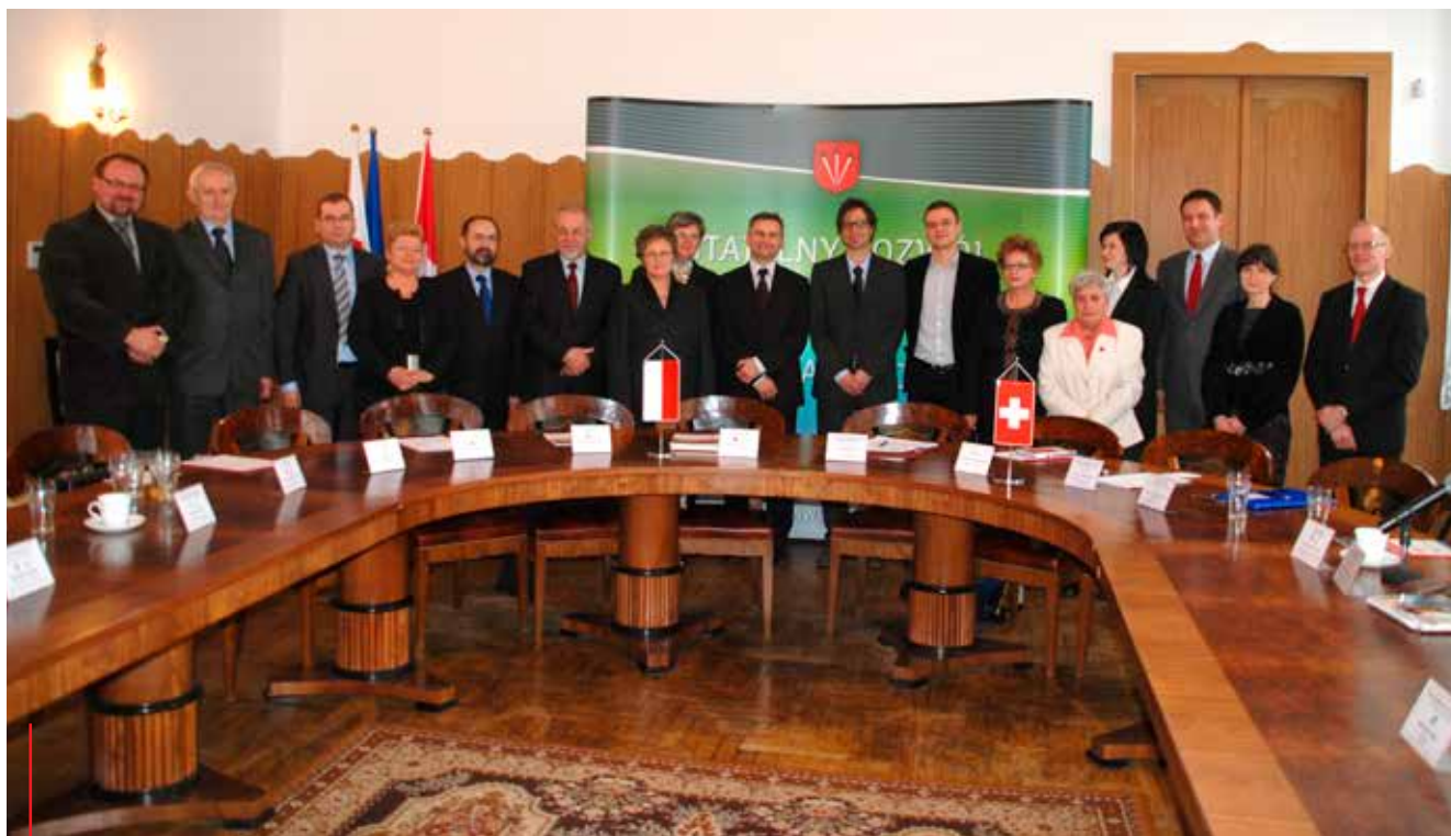
Uroczyste podpisanie umowy w 2007 r. na realizację projektu „Dolina karpia – szansa na przyszłość” pomiędzy burmistrzem Zatora i dyrektorem programu szwajcarskiego.